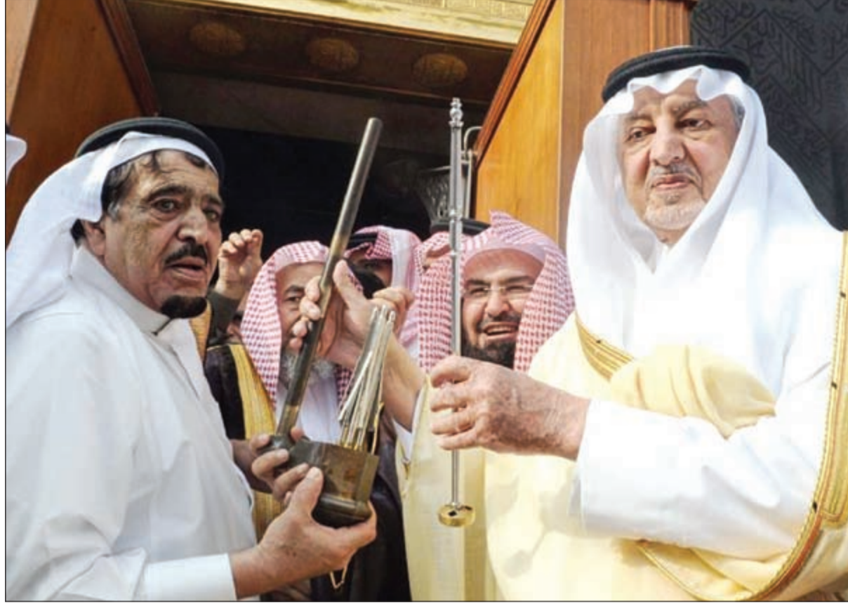
سمو أمير منطقة مكة المكرمة أثناء تسليمه مفتاح الكعبة الجديد