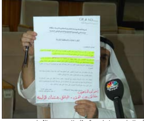
أحد المساهمين يرفع إحدى الأوراق تفيد بوجود تلاعبات