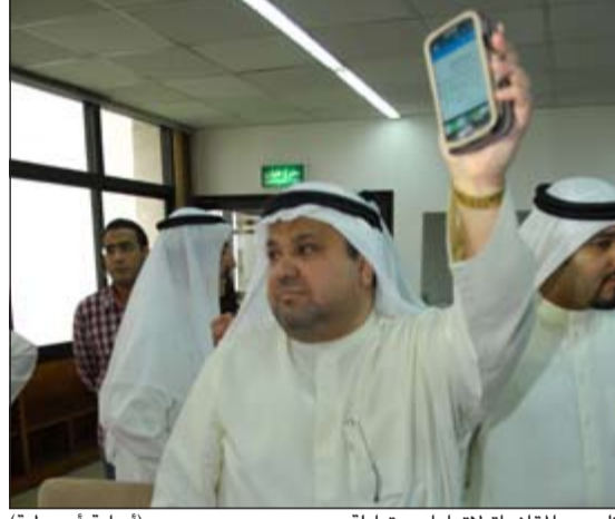
ترويج بالمقاضاة لاتهامات متبادلة (ساسة أبو عبيدة)