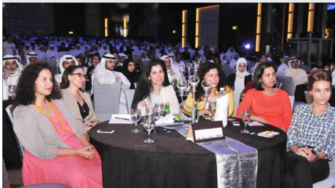
حضور كبير في مؤتمر تمكين