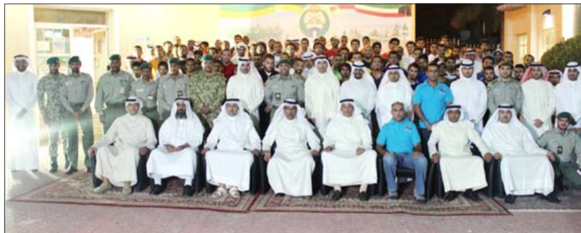
العميد الركن فهد عيد ناصر والمقدم أحمد عبدالرحمن الدعيج مع المشاركين في الدورة

المقدم أحمد الدعيج المتدربين على ضرورة التركيز في تلك الدورات التي ستشتمل على محاضرات توعوية وارشادية وطبية لتحقيق الفائدة المرجوة منها. 4 - الغوص تحت الماء (بشرط إجادة السباحة)، وفيها يكتب حسب المناطق اللازمة للغوص باستخدام المعدات، واتخاذ إجراءات الأمن والسلامة. 5 - تعليم السباحة، من خلال مدربين أكفاء في حمام سباحة أولمبي بأسلوب احترافي. حضر حفل الافتتاح أمر مدار الحرس الوطني العميد الركن نادر شهبان حجيل، ورئيس فرع العلاقات العامة والتوعية العقيد عبدالكريم يوسف العمران، وعدد من الضباط ووفد رسمي من النادي العلمي الكويتي.