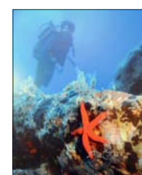
من لوحات المعرض