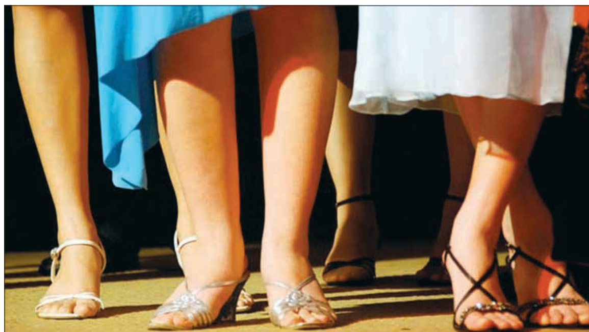
الدوالي السطحية موجودة بكثرة عند السيدات

العيوب الخلقية عند الأطفال في أي سن يجب إجراء جراحات العيوب الخلقية؟