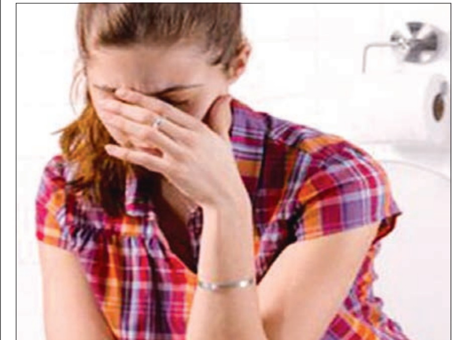
المرحلة الأولى: وجود بواسير داخلية ولكنها لا تظهر أو تخرج خارج فتحة الشرج وقد يشكو المريض فقط من نزول الدم عبر فتحة الشرج.

● انتفاخ في المنطقة الاربية على جانبي عظم العانة. ● ألم او عدم ارتياح في الناحية الاربية خصوصا اثناء السعال او حمل الاشياء. ● احساس بالثقل او الشد في الناحية الاربية. ● عند الرجال قد يحدث احيانا ألم وتورم في كيس الصفن حول الخصيتين عند وصول الفتق الى الصفن.