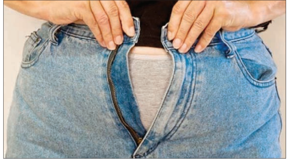
هناك أجهزة تقيس نسبة الدهون الموجودة بالبطن