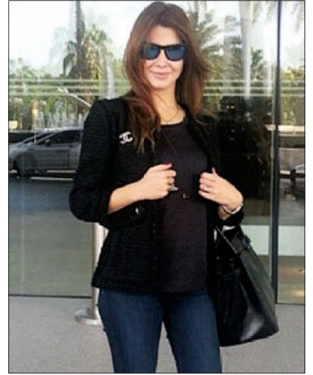
صورة لنانسي وتبدو عليها علامات الحمل

عاد النجمة نانسي عجرم إلى بيروت بعد إحيائها حفلا خاصا في دبي، غير أنها التقطت بعض الصور في مطار دبي الدولي ظهرت «كزنتها» فيها منتفخة، ما دفع بعض المواقع للاعتقاد بأنها حامل. ونفي مدير أعمالها جيحي لامار موضوع الحمل جملة وتفصيلا مؤكدا، في تصريح له، أنها ليست المرة الأولى التي يقال عن نانسي إنها حامل لكن ذلك غير صحيح أبدا وأمام نانسي سلسلة من الحفلات منها في القاهرة ثم تصوير كليب للأغنية الخليجية المفترض أن تصدر ضمن الألبوم مع المخرج فادي حداد نهاية الشهر الجاري، مشددا على وسائل الإعلام ضرورة توخي الدقة والحذر في موضوع خاص جدا مثل موضوع الحمل هذا، في وقت تشغل فيه نانسي عجرم بجديدها وحفلاتها.