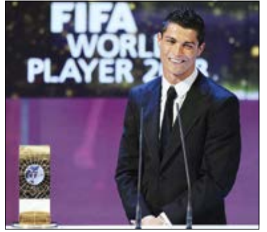
رونالدو قد يغيب عن حفل «فيفا»، في يناير المقبل

كشفت تقارير إخبارية عن أن البرتغالي كريستيانو رونالدو نجم ريال مدريد الإسباني لن يحضر حفل تسليم جائزة الكرة الذهبية، احتجاجا على «المعاملة» التي يتلقاها من الاتحاد الدولي لكرة القدم (فيفا) خلال الأشهر الماضية. وأشارت صحيفة «أس» الإسبانية إلى أن كريستيانو يرى أن المرشحين الآخرين للجائزة، الأرجنتيني ليونيل ميسي لاعب برشلونة الإسباني والفرنسي فرانك ريبيري جناح بايرن ميونخ الألماني تم تقديمهما بشكل أفضل على الموقع الرسمي للـ«فيفا»، وأوضحت الصحيفة أن كريستيانو يعتبر أن الاتحاد الدولي محيز لميسي، وكذلك ريبيري، الأمر الذي أثار ضيق النجم البرتغالي. كما أبدى كريستيانو «استياءه الشديد»، وفقا للصحيفة من التصريحات التي أدلى بها رئيس فيفا جوزيف بلاتر، في جامعة أوكسفورد، والتي سخر فيها من النجم البرتغالي. وكان بلاتر قد صرح مؤخرا بأنه يفضل ميسي على كريستيانو، مشيرا إلى أن الثاني يتفوق الكثير من الأموال على تصفيف شعره وأنه يلعب كالفاندي في الميدان بعكس الأرجنتيني الذي أمطره بوابل من المديح. وتسببت تصريحات بلاتر في استياء مسؤولي نادي ريال مدريد لاسيما أن الكشف عنها تم بالتزامن مع الإعلان عن القائمة المبدئية للاعبين المرشحين للفوز بجائزة الكرة الذهبية لأفضل لاعبي العالم لعام 2013، والتي ضمت 23 لاعبا على رأسهم ميسي ورونالدو وريبيري.