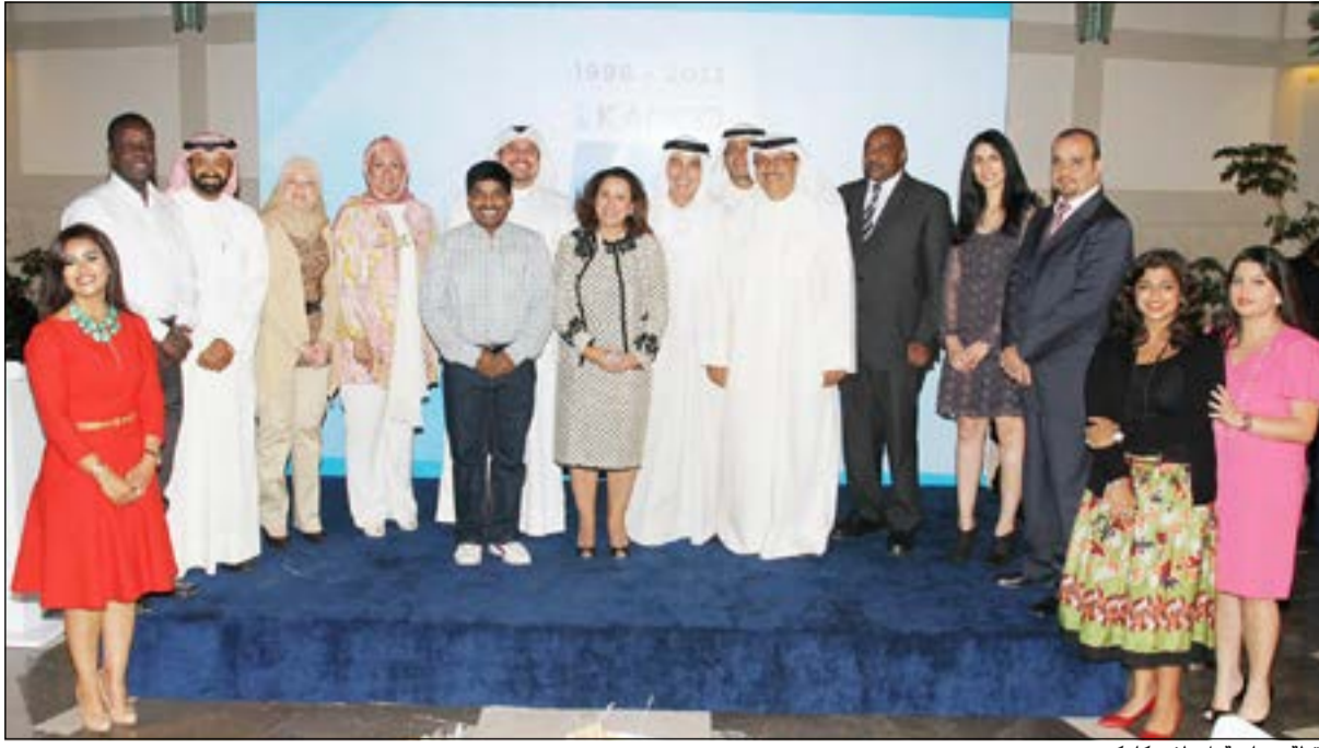
لقطة جماعية لموظفي كامكو

واقترح المطوع عند إنشاء الصندوق البيئي تخصيص 20% من ميزانيته للتوعية من خلال المناهج الدراسية لتثقيف الأجيال القادمة، مشيراً في الوقت ذاته إلى أن الحكومات والبرلمانات السابقة لم تقم بالدور المطلوب بالاهتمام بالبيئة التي تعتبر مصدراً أساسياً للأمراض الفتاكة التي أخذت في الانتشار في السنوات الـ10 الأخيرة.