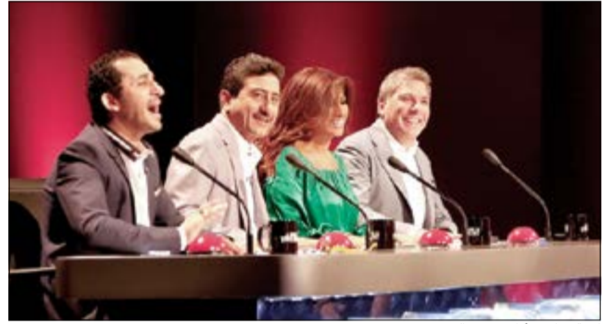
لجنة تحكيم «أرابز غوت تالنت».

هنا فعندما قدمت فرقة راقصا كوميديا يعتمد على فكرة بسيطة ومسلية، ويسرد فيها عملية سطو جلبوا على أثرها الدولارات لنجوى كرم، اتهمها علي جابر مازحا بتقاضيتها الرشوة، لترد عليه: «أنا نجوى ونجوى ما بتقبل الرشوة»، ثم توجهت الى الفرقة: «مستوطنين حيطي الشباب وجبتو الدولارات لعندي على أساس أنا ست وبحب المصري غلطانين أنا عم يشتغل لترجع الليرة على لبنان وأنا نجوى ما بتهمني الدولارات» ليلعل أحمد حلمي على أداء الفرقة وقال: «انتو حرامية ومكف خفيف».