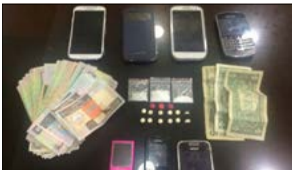
..هواتف ومفاتيح مركبات