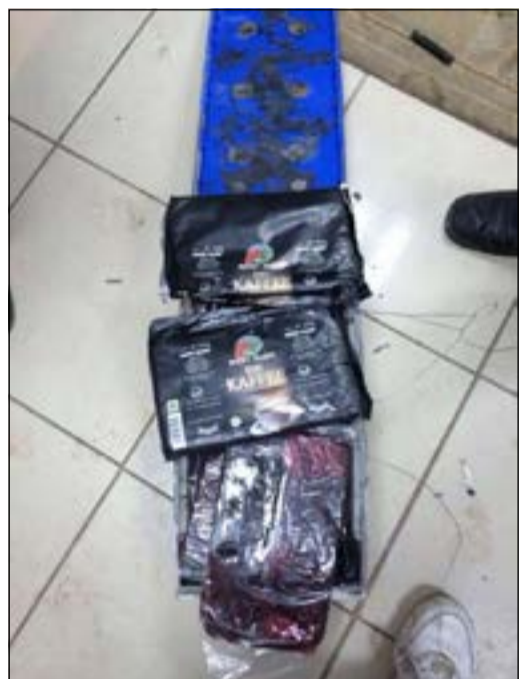
الحشيش بعد تفريغه من البطاريات