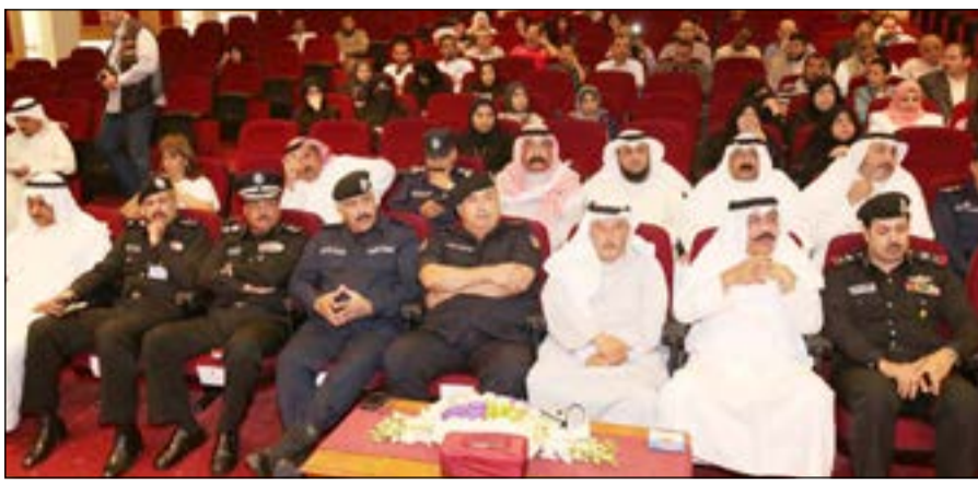
الفريق سليمان الفهد متوسطاً د.السندان وكبار قيادات «الداخلية».

بين عشية وضحاها، بل من خلال ممارسات وتجارب متواصلة تستهدف إلى نشر خلق التسامح وتعزيزه بين أفراد المجتمع لما له من انعكاسات إيجابية على شتى نواحي الحياة وعلى أمن الوطن، كما أنه يكفل تقليل نسبة الجريمة، كما أننا نشارك العالم في الاحتفال بهذا اليوم العالمي للتسامح الذي يصادف 16 نوفمبر من كل عام. وشدد الفريق الفهد على ضرورة ترجمة ما جاء في الخطاب السامي لصاحب السموقدوة حسنة لنشر خلق التسامح والصفح بين بعضنا البعض لتهدياً بها نفوسنا وترقي بها أرواحنا وتنتقل إلى عزة وطننا وازدهاره.