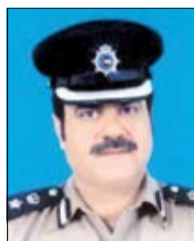
العقيد سلمان المزعل

حجز 979 مركبة ودراجة نارية في كراج الحجز وإحالة 175 شخصا ما بين مواطن ومقيم إلى نظارة المرور وبلغ عدد الحوادث المرورية 1732 حادثاً. وقال مصدر أمني إن محافظة حولي التي يرأس قسم الحركة بها المقدم سعد الرجيب جاءت في الترتيب الأول من حيث عدد المخالفات إذ سجل مرور حولي 13467 مخالفة وحجز 121 مركبة مخالفة وأحال 15 شخصاً إلى نظارة المرور لمخالفتهم قواعد وانظمة المرور وارتكابهم مخالفات جسدية، وجاء مرور الفروانية في الترتيب الثاني حيث سجل مرور الفروانية 6370 مخالفة وأحال إلى