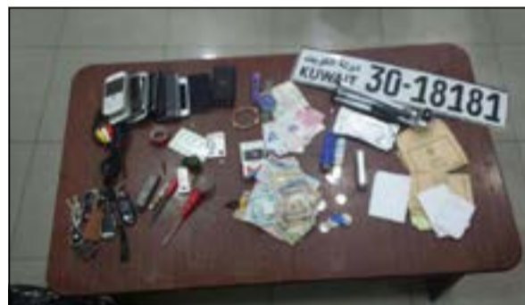
المخالف ضبط بحوزته لوحة مركبة تعود لشخصية ومواد مخدرة

وسجلت بحقه عدة قضايا وهي تزوير لوحات وحيازة مواد مخدرة وقيادة مركبة في حالة سكر واشتباه بسرقة مركبة. وقال مصدر أمني إن رجال الأمن اشتبهوا في مركبة صاحبها في حالة غير طبيعية، وعليه تم إخطار مدير قسم الحركة في مرور حولي المقدم سعد الرجيب والذي بدوره أمر بالتدقيق على شاصي المركبة، ليتبين أن هناك تزوير في الشاصي، ويتفتش السيارة عثر بداخلها على لوحة تبين أنها مسروقة إلى جانب العثور على مواد مخدرة و7 مفاتيح لمركبات وكاميرا فيديو وهواتف نقالة و4 آيبود وفلاش ميموري وادوات لفك اللوحات ومبلغ 403 دنانير.