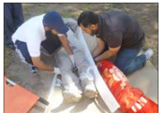
جانب من التمرين في «الكهرباء»