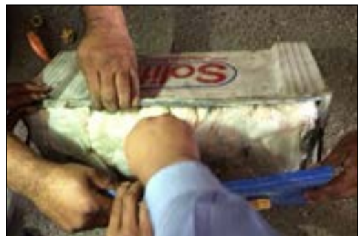
الحبوب المخدرة وقد وضعت بطريقة مبتكرة داخل بطارية