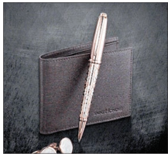
تصميم ابتكاري لقلم Worldcode

وتلتقي هذه التشكيلية مع مجموعة أخرى من الإكسسوارات الضرورية لمحبّي الأناقة لتكتمل بجرأة أناقة الرجل مع أزرار القمص التي يشبه تصميمها خطوط هذا القلم، ما يمنحه إشراقه إضافية، إلى جانب حافظات النقود المصنوعة من جلد التمساح الجدير بالذكر أنه ومنذ العام 1885 كان اسم «سانت أونوريه - Saint Honore» مرتبطاً بالأسلوب الفرنسي العالمي الشهير، وقدمت تصاميم غير مسبوقة للساعات الإكسسوارات، ومن باريس انتقلت إلى نيويورك، وطوكيو وديبي والكويت، وساعد في انتشارها الخبرات الاستثنائية في تصنيع الساعات بجاذبية لا تقاوم، كما توفر روحاً فريدة ومواد عالية الجودة تعكس أصالة علامتها التجارية.