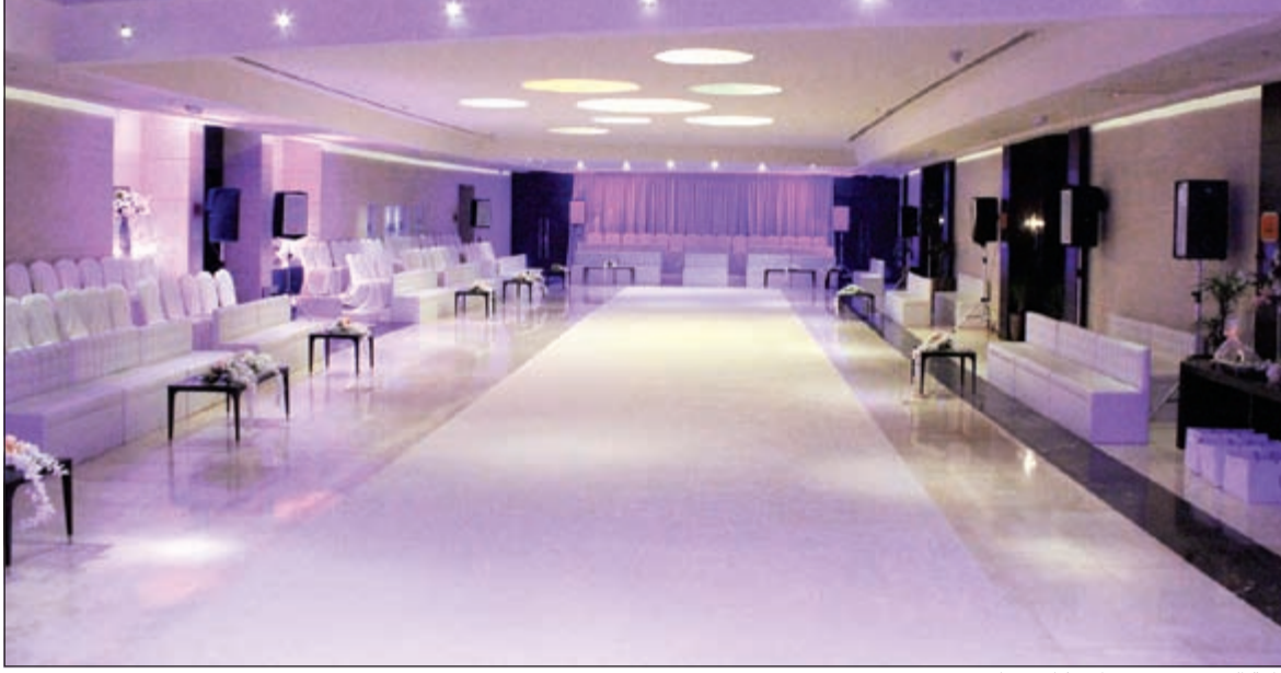
قاعة السيف بتصميم استثنائي معاصر

زفافكم في قاعة السيف للاحتفالات الكبرى بفندق سفير الفنتاس ذكرى لا تنسى. الجدير بالذكر ان فندق وريزيدنس سفير الكويت يشكل الملكية الخامسة من سلسلة فنادق سفير في الكويت، ويعتبر المكان الأنسب لرجال الأعمال والسياح، بما يقدمه من نشاطات وخدمات وتسهيلات متنوعة. ويستطيع الضيوف الاختيار من بين 150 غرفة وجناح إلى شقق سكنية مخدمة، بغرفة أو غرفتي نوم، ويوفر الفندق متعة العيش الجميل والمناظر المذهلة والفاخرة للمدينة والخليج العربي.