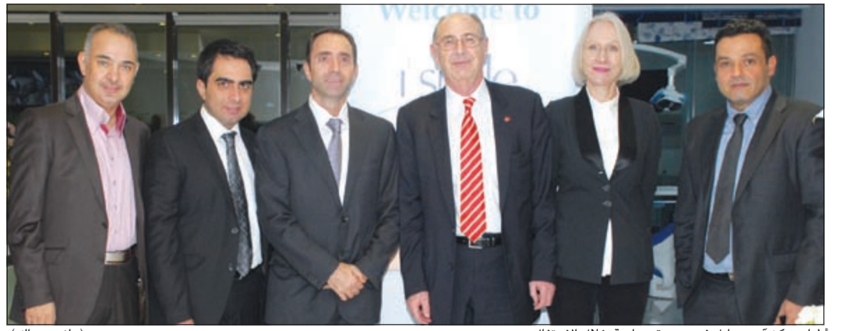
أطباء مركز أي سمايل في صورة جماعية خلال الاحتفال (هاني عبدالله)

ضروريان، لأن مرض السكري غير المنضبط يؤدي إلى مضاعفات خطيرة مثل أمراض القلب، السكتة الدماغية، الفشل الكلوي، تلف الأعصاب، فقد البصر، المشاكل الجنسية والتهابات المسالك البولية. كما لفت