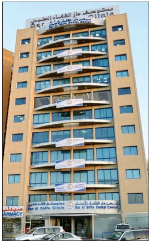
دار الشفاء كلينك

احتفل «دار الشفاء كلينك» باليوم العالمي لمرض السكري، الذي صادف يوم 14 نوفمبر، وبهذه المناسبة، يقدم لسواره مجموعة واسعة من العروض على فحوصات مختلفة في الفترة بين 17 وحتى 27 نوفمبر الجاري. وتشمل العروض المقدمة في هذه المناسبة، خدمات صحية مجانية للمرضى الذين يزورون «دار الشفاء كلينك»، تشمل فحص نسبة السكر في الدم وقياس ضغط الدم ووزن الجسم، إضافة إلى معلومات تثقيفية واستشارات حول مرض السكري ومتطلبات التعايش معه، إضافة إلى كيفية الوقاية منه ومكافحته، ومجموعة من النصائح المتعلقة بالنظام الغذائي الواجب اتباعه من خلال المنشورات الدعائية التي يتم توزيعها بهذه المناسبة.