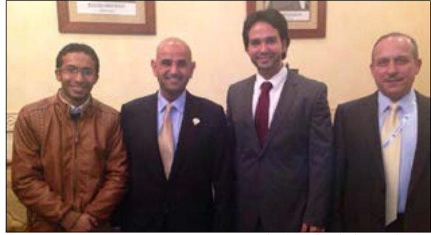
د.نايف الحجرف خلال استقباله وفد الاتحاد

أكد رئيس اتحاد طلبتنا بفرنسا والسدول المجاورة سعود روح الدين أن وزير التربية والتعليم العالي د.نايف الحجرف وعد بدراسة كل مطالب الطلبة الدارسين في فرنسا. وأضاف روح الدين أن الاتحاد ومجموعة من الطلبة التقوا مع وزير التربية والتعليم العالي د.نايف الحجرف ورئيس المكتب الثقافي والمحقق الثقافي الرضوان والمحقق الثقافي الطراح المنسوب الدائم للكويت في منظمة الامم المتحدة - يونسكو لبحث أبرز الصعاب التي يواجهها الطلبة المتبعثون والدارسون على نفقتهم الخاصة. وقال تم مبادلة الحديث والنقاش وفتح باب المشاكل والصعاب التي تواجه الطلبة في الخارج وأيضا تم عرض متطلبات واحتياجات الطلبة اللازمة لإكمال المسيرة الدراسية والتي لاقت اهتماما