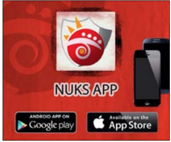
خدمة تطبيق الهواتف الذكية