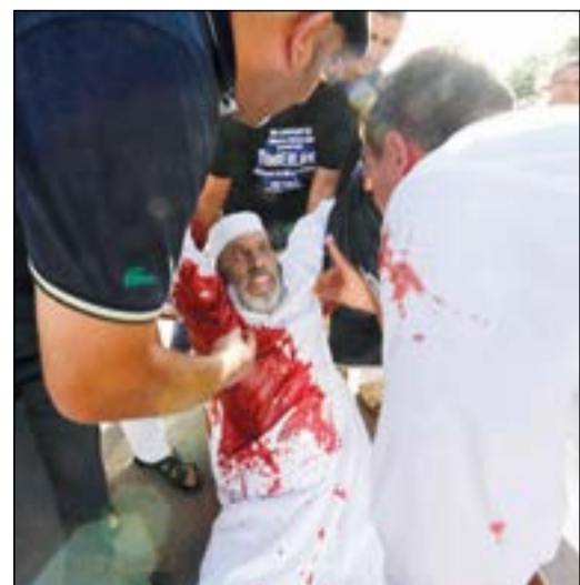
أحد المصابين خلال الاشتباكات في ليبيا أول من أمس