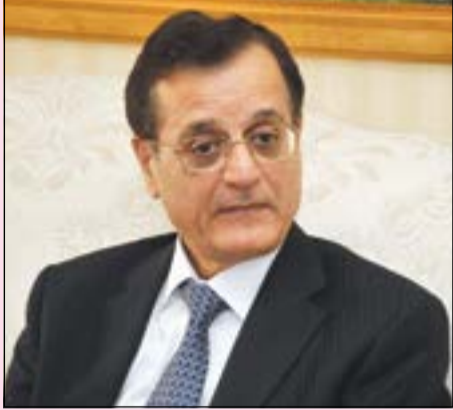
الوزير عدنان منصور

وزير الخارجية اللبناني عدنان منصور في حوار خاص مع «الأنباء»: