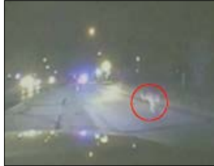
لكنغر يجوب الشوارع

يو.بي.أي: أثار حيوان كنغر ضجة كبيرة غرب تكساس بعد ان رآه السكان يجوب الشوارع ويتنقل من مكان إلى آخر.