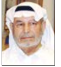
أيوب الأيوب رحمه الله

غيب الموت أمس الفنان التشكيلي والمربي والمؤرخ الكويتي أيوب حسين الأيوب الفناي عن عمر يناهز الـ 81 عاما بعد مشوار حافل بالإنجازات الفنية التي خدمت التراث الكويتي، خصوصا ما يتعلق منها برسم البيئة الكويتية القديمة.