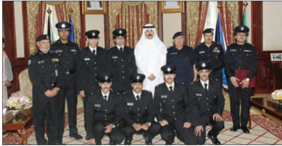
الشيخ محمد الخالد وقيادات الأكاديمية يتوسطون الخريجين

والخريجات دوام التوثيق والنجاح في علمهم المقبل، مبرزاً أهمية القسم الذي أنوه. وجدد التأكيد على انه لا أحد فوق القانون، فالجميع سواسية، مشدداً على ضرورة التعامل مع المواطنين والمقيمين بكل الاحترام والتقدير وأيضا بكل الحزم. وقد أصدر مجلس الوزراء بتعيين خريجي جامعة بيدفورد شير بالمملكة المتحدة برتبة ملازم اعتباراً من 2013/7/26 وخريجي كلية الشرطة برتبة ملازم اعتباراً من 2013/9/16 المساندة برتبة ملازم اعتباراً من 2013/9/16.