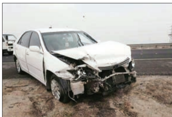
.. وتصادم النويصيب صرع سيدتين

تمكن رجال الإدارة العامة لمكافحة المخدرات بقيادة المعيد صالح الغنام وتحديدًا إدارة المكافحة الدولية، من ضبط تشكيل عصابي ثلاثي مكون من مواطن وشخصين من جنسية عربية بحوزتهم 25,000 حبة (كبتاغون) المخدرة، وعدد 9 قطع حشيش، وعدد 20 سيجارة حشيش، وعدد 60 حبة فالسيوم، وعدد 2 غرام من مادة الشبو وعدد 5 مسدسات وطلقات نارية. كانت قد وردت معلومات سرية إلى رجال المكافحة عن