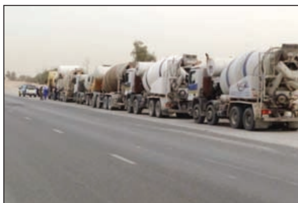
الخلاطات على جانب الطريق لتحرير مخالفات لسائقها

المقدم مطر السسيل وتبين وفاة قائد المركبة وهو شاب خليجي، فيما تم نقل مراقبيه إلى المستشفى. من جانب آخر، اغلق رجل المرور الحارة اليسرى لطريق الدائري الرابع السريع بسبب حوادث تصادم وتجنبيه المارة، فيما أفاد المصدر بان الحادث الذي وقع صباح امس لم يتسبب في وقوع اصابات وكان الأضرار بالمركبات من جهة أخرى، لقيت سيدتان خليجيتان مصرعهما اثر حادث تصادم على طريق