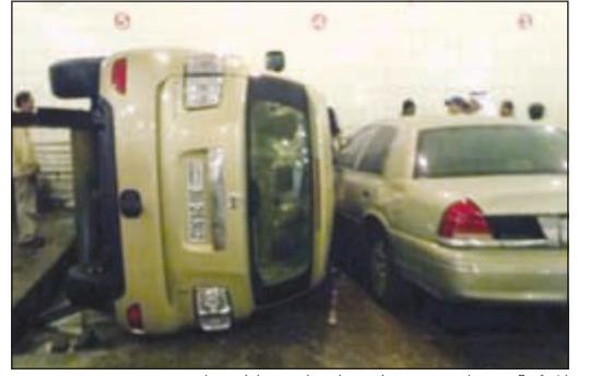
المركبة وقد استقرت على جانبها وقد اتلفت أخرى