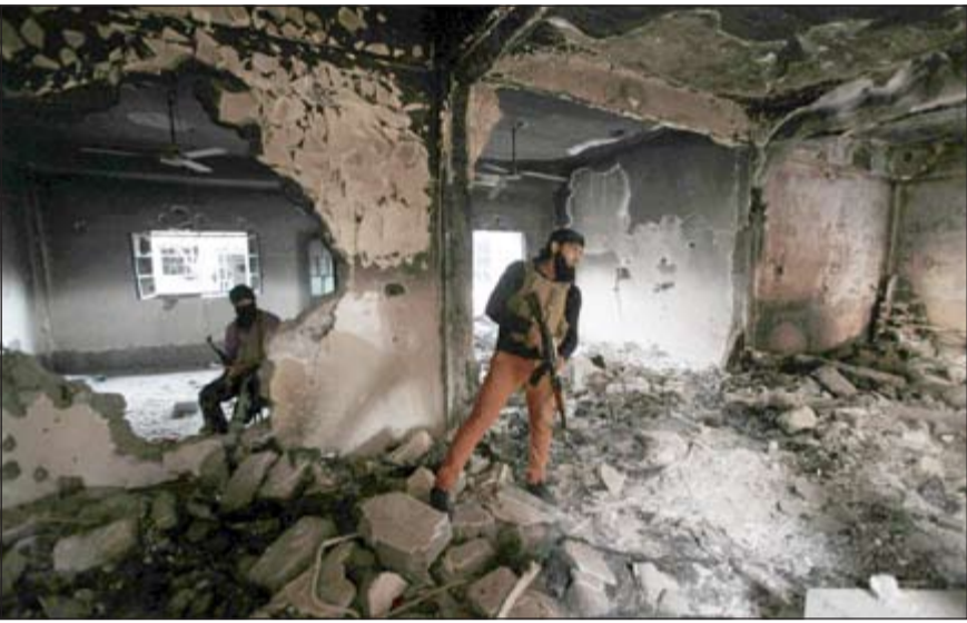
عنصران في الجيش الحر يتجولان في مبنى مدمر في دير الزور

القصف الأحياء «المحررة» بالمدينة، في ظل اشتباكات على أطراف حي الرشدية، تزامناً مع الاشتباكات المتمركزة في الفرقة 17 شمال مدينة الرقة.