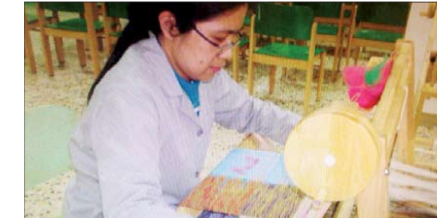
جانب من العمل اليدوي للسدو