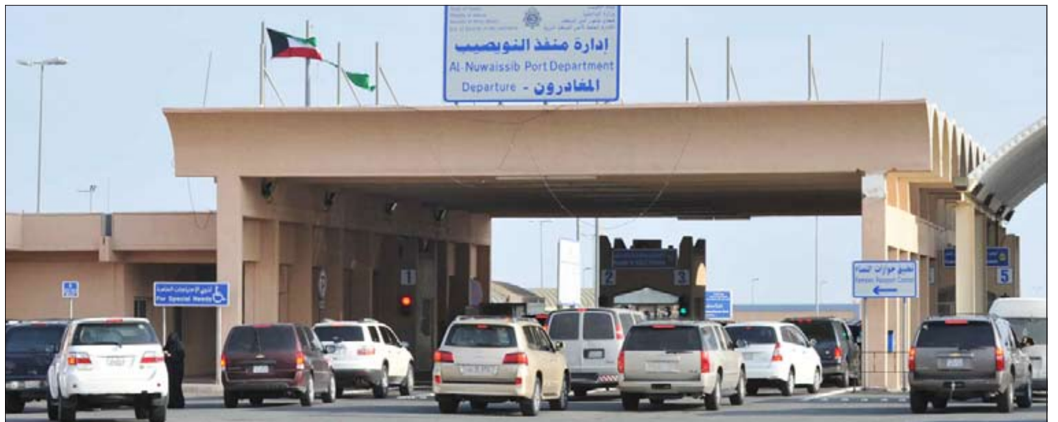
مرونة في حركة المغادرة بعد تدشين البرنامج