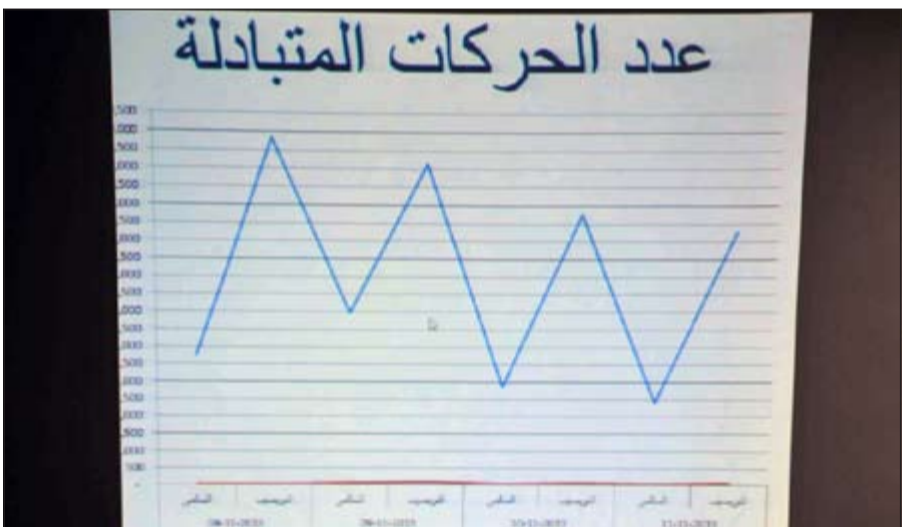
مؤشر الحركات المتبادلة

الخميس: نتائج عملية الربط الآلي سيجني ثمارها موظفو منفذي النويصيب والخفجي