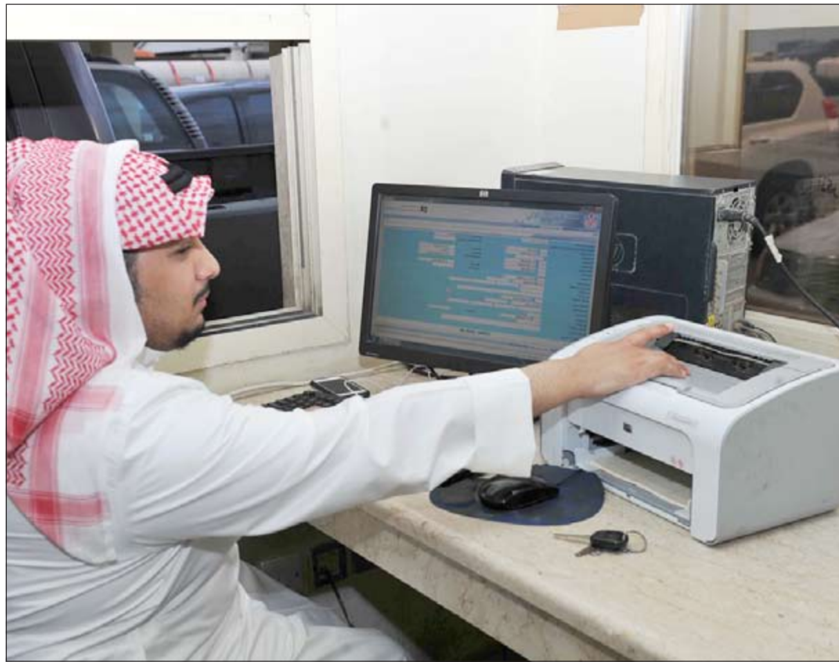
ظهور البيانات المسجلة في المنفذ الآخر داخل البرنامج مباشرة