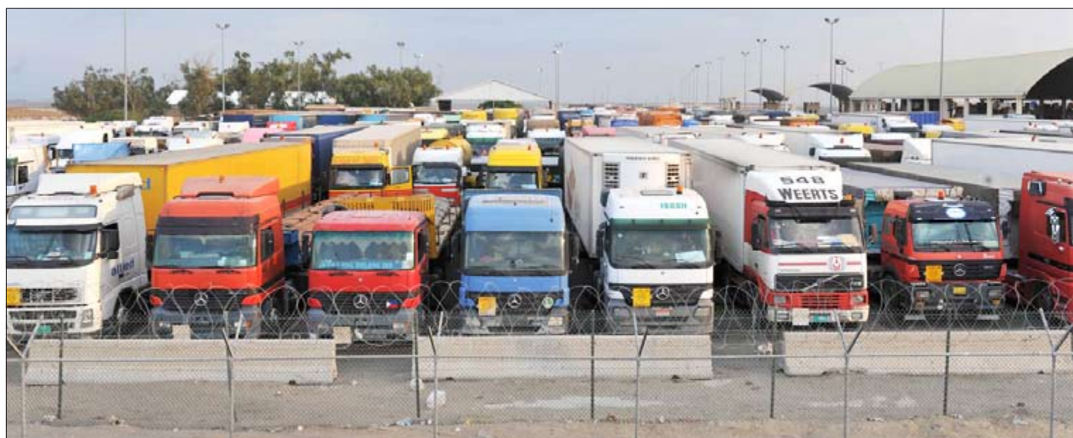
آلاف الشاحنات تعبر منفذ النويصيب يومياً