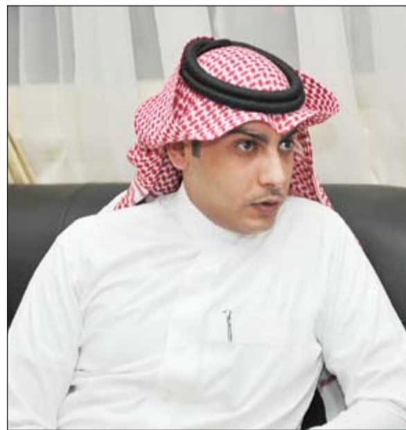
رئيس الفريق السعودي عيسى العنزي متحدثاً للصحافيين