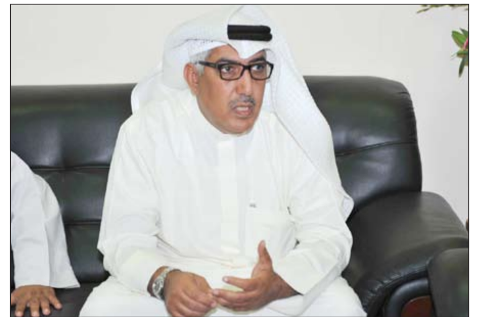
مهلهل المصنف متحدثاً عن أهمية المشروع

توصية اللجنة الجمركية الكويتية-السعودية بعد عدة اجتماعات عقدت بهذا الشأن، حيث قام الجانبان بتهيئة النظم الإلكترونية الخاصة به لتتوافق مع الأخرى لإتمام عملية الربط وأوضح العجمي أن عملية الربط هي عملية ربط أجهزة الحواسيب الإلكترونية الخاصة بإدارات الجمارك في الكويت والمملكة العربية السعودية وإتمام إجراءات إنهاء حركة خروج أو دخول المركبات من خلال أي من منفذ جمركي ليكون باستطاعة المنفذ الجمركي المقابل الحصول على تلك المعلومات مسبقاً والإطلاع عليها ومطابقتها مع المستندات الأصلية التي بحوزة المسافر بكل يسر وسهولة مما يخفف العبء على الموظف ويسهل حركة إنهاء إجراءات المسافرين مشيراً إلى أنه تم الانتهاء من عملية الربط بين منفذي السالمي والرفعي. وأعرب العجمي عن أمله في الانتهاء من عملية ربط البيانات الجمركية للإرساليات «الصادرة» والواردة «العابرة» (ترانزيت) في المرحلة القادمة ولفت العجمي إلى أن منفذ النويصيب الرابط والخادم الوحيد لحركة المسافرين والبضائع بين الكويت ودول