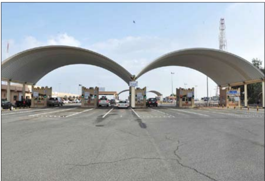
منفذ النويصيب يحتاج إلى إعادة تأهيل ليستوعب الضغط الكبير عليه