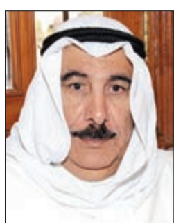
شعر: علي يوسف المتروك