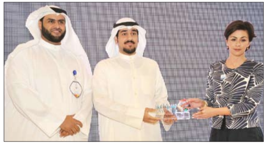
الشيخة الزين الصباح تكرم احد المشاركين

أكدت وكيلة وزارة الدولة لشؤون الشباب الشيخة الزين الصباح أن العمل التطوعي هو من أسس تقدم الأمم وازدهارها، مؤكدة أن الوطن الواعد يرسم بأيد شبابية يتكاتفون لتحقيق الانتشار والتأثير الأمل والإيجابي في المجتمع بهدف تطوير ونشر العمل التطوعي الجماعي. وقالت ما أجمل أن يعمل الإنسان بدافع العطاء وخدمة المجتمع بما هو إيجابي ومفيد، ويعمل ليعزز قيمة إيجابية أو ينشر رسالة هادفة أو يخدم في مجاله الذي يتميز به. كلام الصباح جاء خلال مشاركتها في حفل افتتاح نشاطات ملتقى «سواعد» الثاني الذي يقام برعاية وزير الإعلام ووزير الدولة لشؤون الشباب الشيخ سلمان الحمود، حيث قالت إن وزارة الشباب تتشرف بالمشاركة في هذا الملتقى الرائد الذي يجمع بين 100 فريق تطوعي