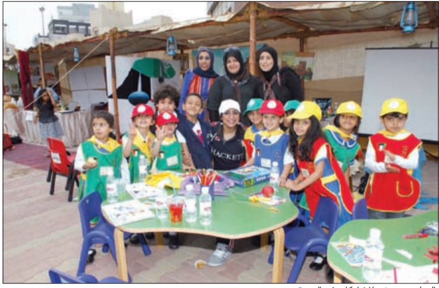
الهولي مع بعض المشاركات في الدورة