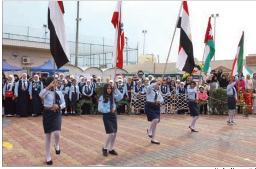
الطلبات خلال الحفل

وعلىنا مواكبة العصر مع وتمكين بالتمسك بالثقافات والشابات من تحقيق كامل قدراتهن كمواطنات مسؤولات في العالم، وهذا أحد أهداف المخيم، فتعد الورش الفنية والإرشادية والتربوية وفق هذه الأهداف ولي ثقة كاملة في بناتنا في الجهات والمرشدات وأخواتي الموجهات والقائدات في تحقيق شعار وأهداف الدورة.