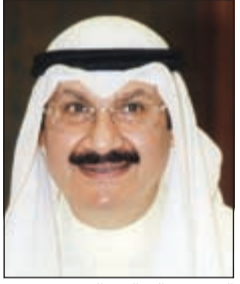
الشيخ سالم عبدالعزيز

رد نائب رئيس مجلس الوزراء ووزير المالية الشيخ سالم عبدالعزيز حول ما أثير عن وجود مواجهة بينه وبين العضو المنتدب لهيئة الاستثمار، مؤكدا ان الأمر غير صحيح. وقال الوزير: «ان محتوى ما نُشر عن ان المالية تطلب تقارير مفصلة عن استثمارات الهيئة الداخلية والخارجية» غير صحيح نصا ومضمونا.