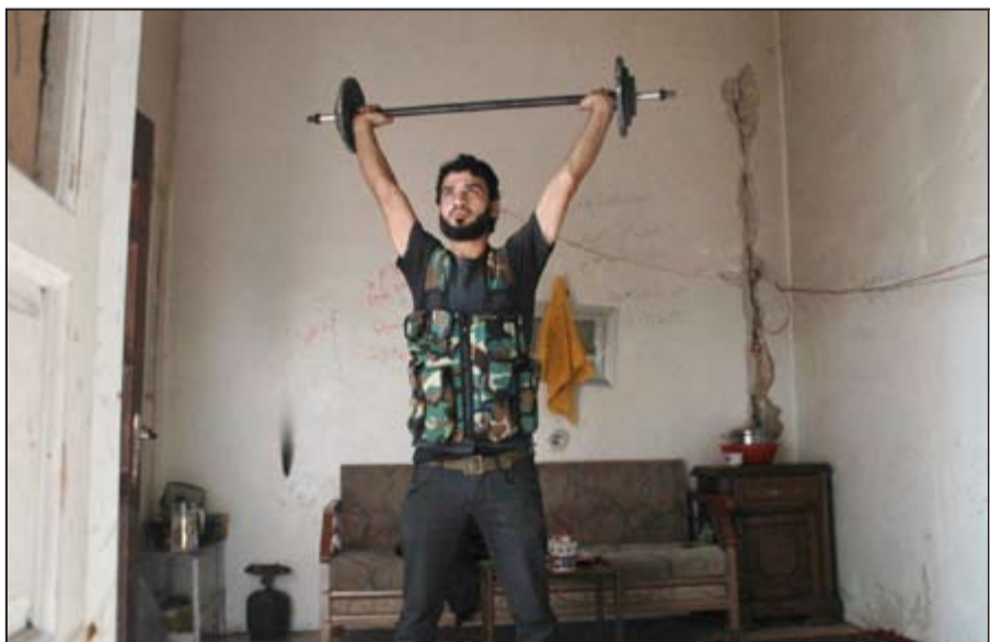
عنصر في الجيش السوري الحر يمارس الرياضة