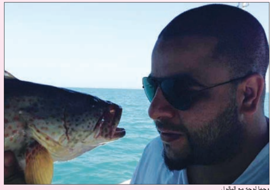
وجها لوجه مع البالول