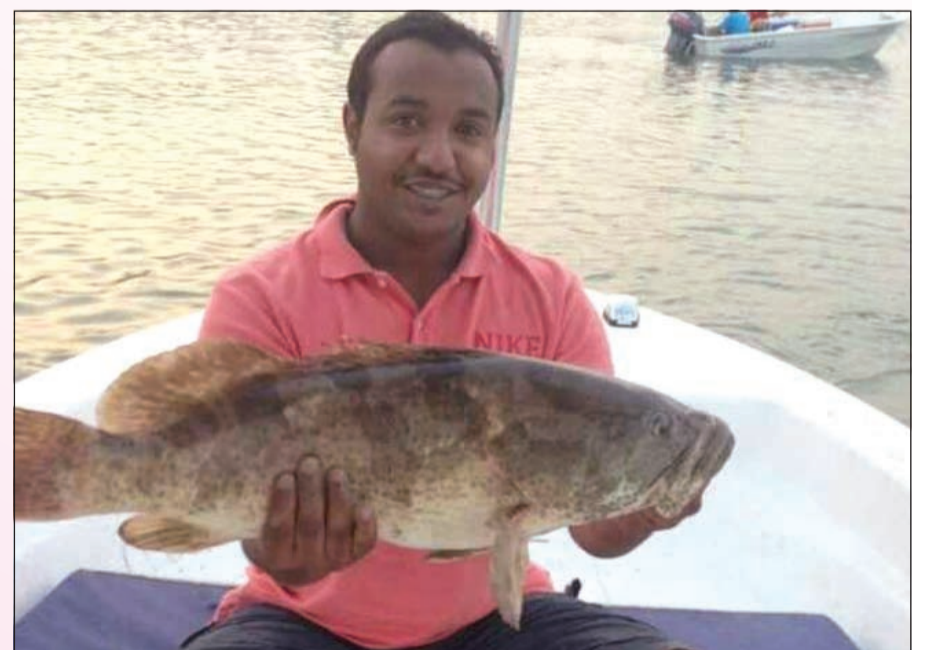
جذاعي ولا أزوع