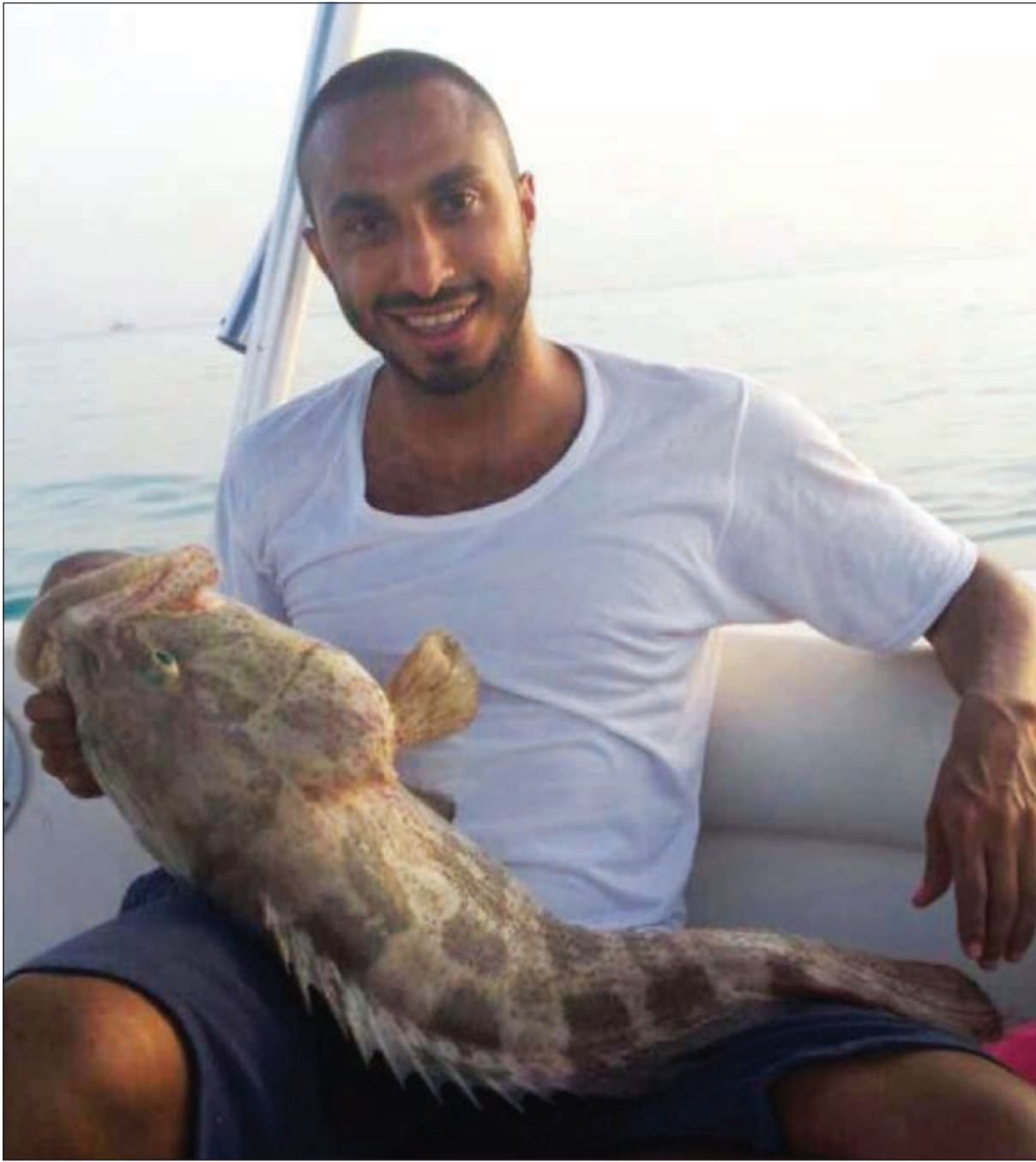
هامور عوثة وأقواع كثر شي خيال