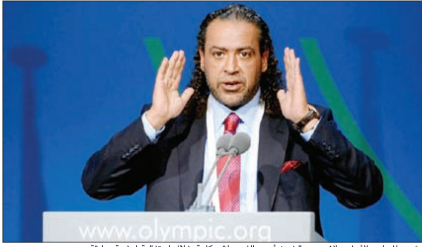
رئيس المجلس الأولمبي الآسيوي الشيخ أحمد الفهد يلقي كلمة خلال احتفالية أولمبية سابقة

إلى ذلك أعلن المجلس الأولمبي الآسيوي أمس تأجيل جمعياته العمومية التي كانت مقررة في جزيرة بوراكا في الفلبين أواخر الشهر الجاري بسبب الإغصاء المدمر الذي ضرب البلاد. وقال الشيخ أحمد الفهد رئيس المجلس ورئيس انوك (اتحاد اللجان الأولمبية الوطنية) في رسالة وجهها إلى اللجان الأولمبية الآسيوية «كما نعرفون فإن الفلبين تعاني من إحدى أكبر المآسي في تاريخها بسبب إعصار هايان الذي أثار على حياة ملايين الأشخاص فيها». وتابع «أن المجلس الأولمبي يقف خلف أشقائه في الفلبين وسيقوم بما يستطيع للتخفيف من معاناة الذين تضرروا بهذه المأساة، ونظرا لحجمها فإن المجلس قرر تأجيل جمعياته العمومية الثانية والثلاثين ومهرجان المثوية للألعاب الآسيوية في بوراكا في 27 إلى 29 الجاري». وأشار إلى أن الموعد الجديد للجمعية العمومية «من المرجح أن يكون في منتصف يناير المقبل على أن يتم تأكيده لاحقا».