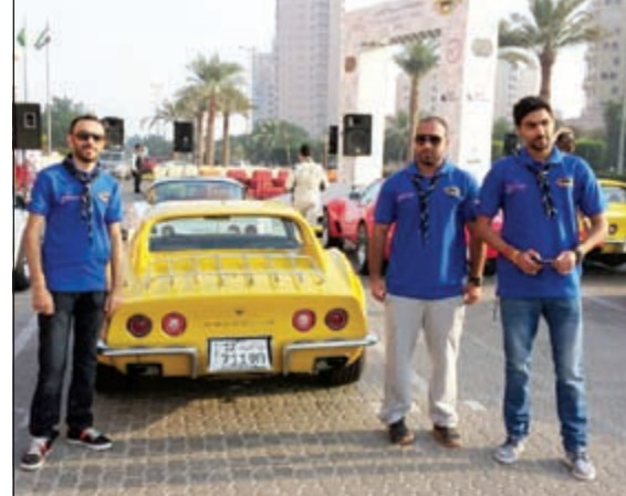
دور مهم لجواله العشيرة بتنظيم الرالي