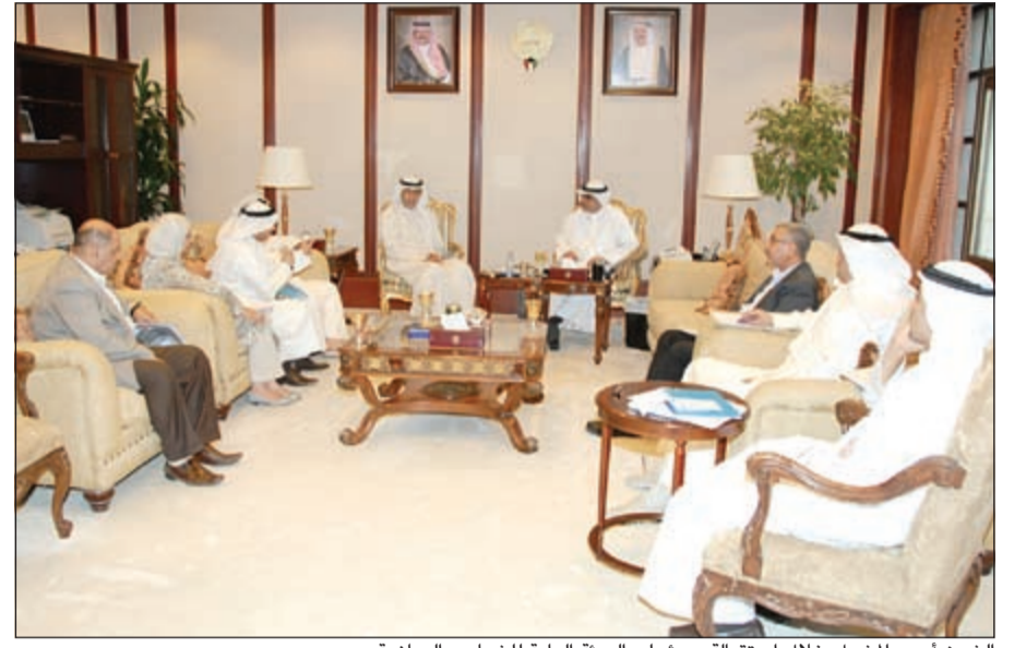
الشيخ أحمد المشعل خلال استقبالي الهيئة العامة للشباب والرياضة

كل من الهيئة والاستشاري والمقاول المنفذ وان يراعي فيه تعويض التأخير الحاصل وموافاة الجهاز بنسخة منه بعد اعتماده بصورته النهائية وذلك خلال اسبوعين على الاخر حتى يتسنى متابعة المشروع بكل تفاصيله، وأكد على ضرورة بذل المزيد من الجهد للانتهاء من المشروع نظرا لأهميته في المنظومة الرياضية للدولة.