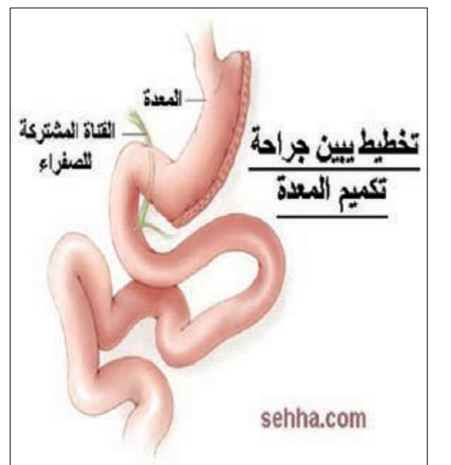
ممارسة تكيم المعدة