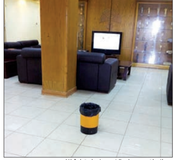
«سطل» لتجميع مياه «الخريز» في استراحة المذيعين

مما يؤدي إلى تعطل العمل فيها. وأضافت المصادر أنه لا يوجد أحد من مسؤولي الإذاعة يستطيع التصريح حول مشكلة «خريز» الإذاعة امتثالا للتعميم الصادر من قبل وزارة الإعلام بعدم