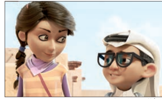
من أفلام «صنع في قطر»

«بطل ورسالة» من إنتاج شركة الريان للإنتاج. وفي هذا الإطار، قالت مديرة مهرجان أجيال السينمائي فاطمة الريمحي «تتويجا لجهود المخرجين الواعدين سيقوم برنامج «صنع في قطر» في مهرجان أجيال السينمائي بتكريم مواهبنا المحلية أمام جمهور ذواق للسينما، وذلك تقديرا لتفانيهم والتزامهم. سيقدم البرنامج للمشاهدين نظرة ثاقبة حول ما يكتنزه وطننا من مواهب إبداعية خلّاقة، كما سيتم دور مؤسسة الدوحة للأفلام في تشجيع المخرجين على اتخاذ خطوات أكثر جدية واحترافية لتطوير مسيرتهم المهنية».