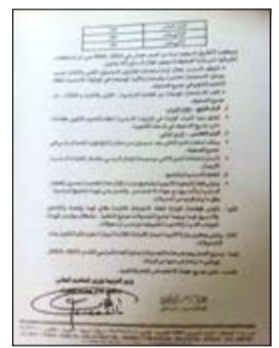
القرار الوزاري رقم (2013/246) الصادر بتاريخ 4 سبتمبر الماضي

وكان القرار الوزاري رقم (2013/246) الصادر عن وزير التربية ووزير التعليم العالي د.نايف الحجرف بتاريخ 4 سبتمبر الماضي في شأن تعديل الوثيقة الأساسية