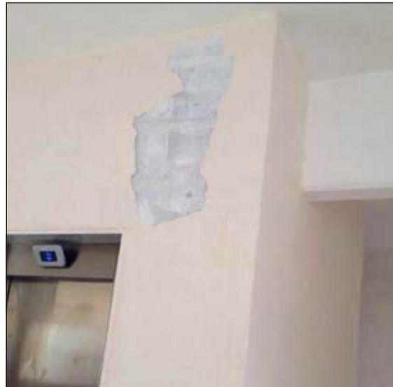
الأصباغ في المبنى بحاجة إلى أصباغ