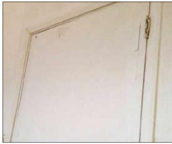
الأبواب من الداخل مع الشراشيب لا تدل على أنها في مدرسة جديدة