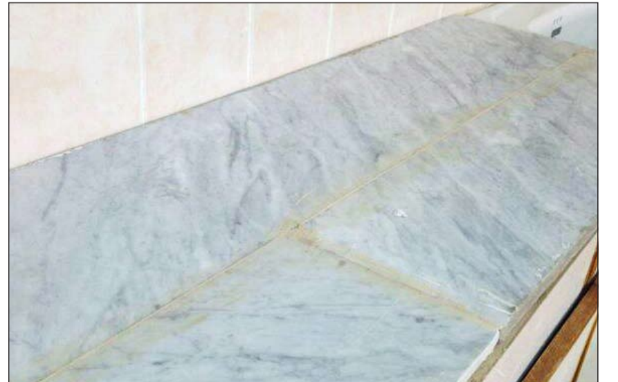
المغسل والأرضيات في الحمامات قديمة