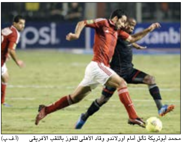
محمد ابوتريكة تلقى أمام أورلاندو وفاد الأهلي للفوز باللقب الأفريقي

واصل مان يونائيد حامل اللقب صحوته والحق الخسارة الثانية بأرسنال المتصدر عندما تغلب عليه 0-1 أمس على ملعب «اولدترافورد» في مانشستر في النطاق المرحلة الحادية عشرة من الدوري الإنجليزي لكرة القدم. ويدين مان يونائيد بفوزه الى مهاجمه وأرسنال السابق الدولي الهولندي روبن فان بيرسي بضربة رأسية من مسافة قريبة اثر ركلة ركنية انبرى لها واين روني في الدقيقة 27 رافعا رسيد له الى 7 اهداف في البطولة الحالية. وضرب فريق «الشياطين الحمر» عصافورين بحجر واحد فهو تابع انتفاضة وحقق الفوز الثالث على التوالي والسادس هذا الموسم وانعش أماله في الدفاع عن اللقب بعدما أوقف الانطلاقة الرائعة لرجال المدرب الفرنسي ارسين فينغر ولقبص الفخاري معهم الي 5 نقاط بعدما ارتقى الى المركز الخامس برصيد 20 نقطة مقابل 25 لأرسنال. في المقابل، فشل النادي اللندني في هز الشباك للمرة الأولى هذا الموسم ومنى بخسارته الأولى منذ سقوطه امام ضيفه استون فيلا 1-3 في المرحلة الأولى. وأشعل مان