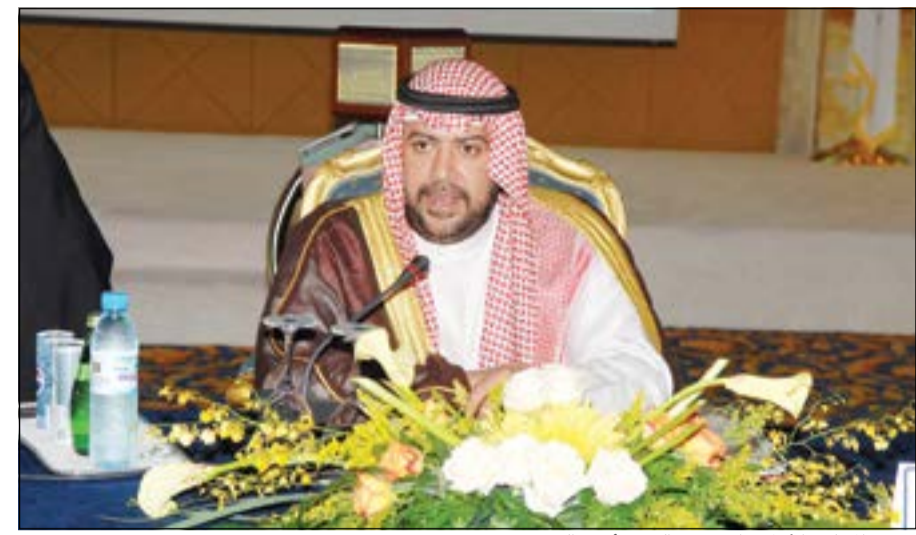
رئيس المجلس الأولمبي الآسيوي الشيخ أحمد الفهد

بزملائه في اللجنة الأولمبية الفلبينية ويتابع بانتظام الوضع في جزر بوراكاى. وتحدثت السلطات في الفلبين عن احتمال ان يكون الإعصار اودى بحياة أكثر من 10 آلاف شخص، في أسوأ كارثة طبيعية في تاريخ البلاد. زيارة للأكاديمية الأولمبية القطرية