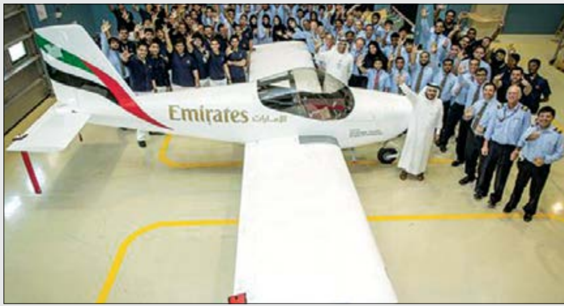
الطائرة المصنوعة بسواعد شبابية إماراتية