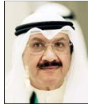
الشيخ سالم العبدالعزیز

● محمود فاروق يبدو أن ما تردد في السوق عن عدم انسجام بين وزير المالية الشيخ سالم العبدالعزیز ورئيس الهيئة العامة للاستثمار بدر السعد بدأ يأخذ طريقه، حيث لم يعد الأخير التدخل المباشر في عمل الهيئة، فقد علمت «الأنباء» من مصادر مطلعة أن وزارة المالية طلبت من الهيئة العامة للاستثمار إعداد وتقديم تقارير شاملة عن استثماراتها المحلية والخارجية متضمنة أداء محافظها الاستثمارية خلال العامين الماضيين فضلا عن التوزيع الجغرافي لأسهم الشركات والبنوك التي تساهم فيها الهيئة سواء في سوق الكويت للأوراق المالية أو في الأسواق العالمية. وأفادت المصادر بأن التقرير الشامل الذي تطلبه «المالية»، يأتي في إطار توجهات بإعادة النظر في السياسة المعمول بها داخل الهيئة العامة للاستثمار سواء داخلها أو الكية التعامل مع الاستثمارات الخارجية التي مضى عليها أكثر من 10 أعوام ماضية بغرض تطويرها استحداثها بما يتوافق مع المعايير العالمية التي تتبعها الصناديق السيادية الموجودة في المنطقة. ويبدو أن وزير المالية يستند إلى تقرير ديوان المحاسبة بخصوص استثمارات الهيئة وما ظهر فيه من ملاحظات وبعض