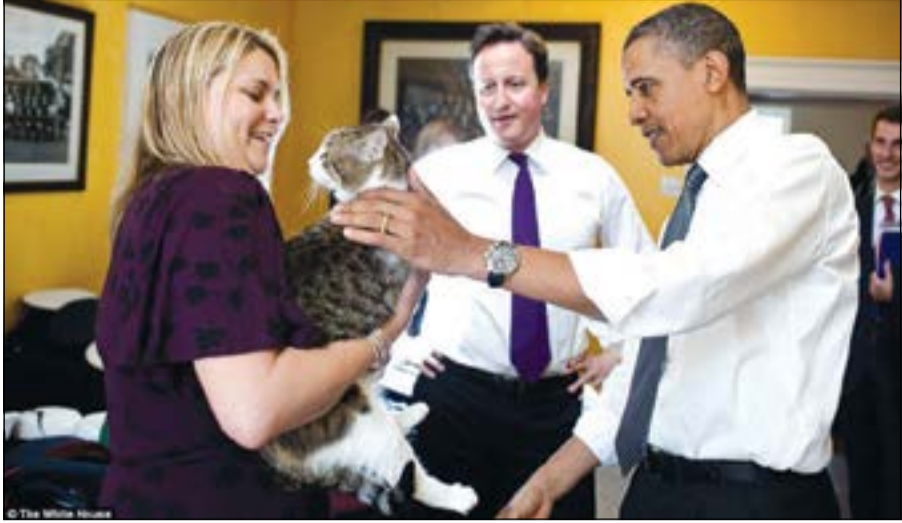
أوباما يداعب لاري.. قط 10 داونغ ستريت

لكن علماء بريطانيين حذروا من أن الإفراط من استخدام السموم ضد هذه القوارض، وامتلاكها مناعة ضدها، يؤدي إلى قتل أي حيوان يحاول أكلها، في إشارة إلى القطط. ونقلت الصحيفة عن مصدر في البرلمان البريطاني أن «مشكلة القوارض تتفاقم، ومبنى مجلس العموم قديم وقريب من النهر ويجوي مستودعا ضخما، ما يجعله مثاليا للجرذان». وأشارت إلى أن هذه الجرذان قادرة على انجاب 14 جردا كل 3 أسابيع، وبعضها ينتج 400 كل عام.