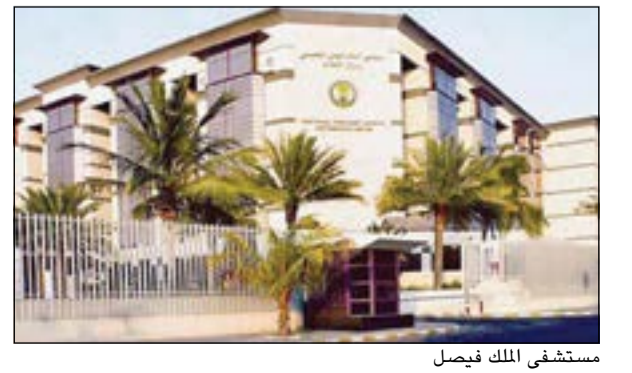
مستشفى الملك فيصل

الرياض - العربية: أكد د.قاسم القصبي، المشرف العام التنفيذي للمؤسسة العامة لمستشفى الملك فيصل التخصصي ومركز الأبحاث، أن مستشفى في الرياض نجح في إجراء 106 عمليات زراعة كبد للأطفال خلال السنوات الـ 3 الماضية، من بينها 38 عملية زراعة كبد أجريت منذ بداية العام الحالي 2013 حتى مطلع شهر نوفمبر الجاري. ولفت إلى أن إجراء هذا العدد من العمليات في عام