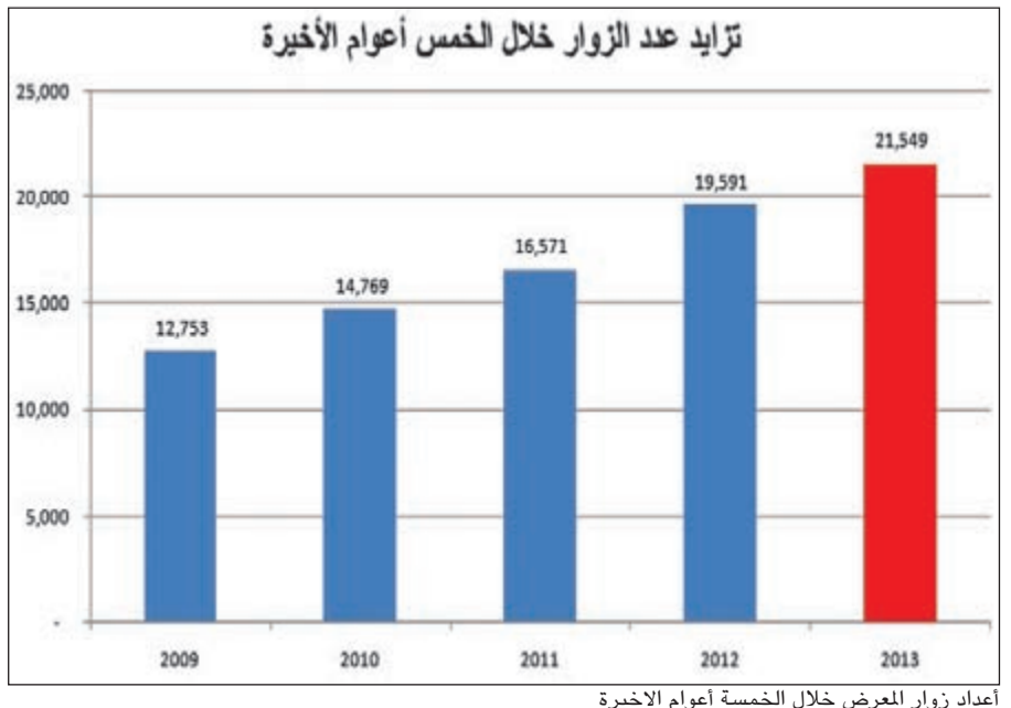
أعداد زوار المعرض خلال الخمسة أعوام الأخيرة