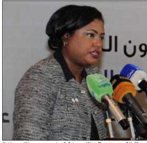
دميلة المكيمة متحدة خلال ورشة العمل (قاسم باشا)

أكد مدير عام لجنة زكاة الشامية والشويخ سالم الحمر أن اللجنة تساهم في إصدار وتوزيع المطبوعات الدعوية السمعية منها والورقية بالمجان، وذلك لأجل تفعيل الجانب الدعوي للجنة، مشيرا إلى أن اللجنة تشارك بهذه الإصدارات في معارض الكتب خلال المناسبات مثل أيام الأعياد الوطنية، وتقوم بتوزيعها على المسلمين في المساجد وغيرها من أجل تنمية الثقافة الإسلامية وتنمية الوازع الديني. وكشف عن قيام اللجنة بطباعة مجموعة إصدارات دينية دعوية للداعية عدنان عبد القادر رئيس مجلس إدارة اللجنة، وذلك لما فيها من فوائد جمة ومنافع عدة وقدم معلومات رائعة يستفيد منها كل من يقرأها. وقال الحمر في تصريح صحفي: لقد قامت اللجنة بطباعة كتاب «المختصر من نثر الماس والدرر في طرق مشيدا بجهود الخيرين المتواصلين مع مشاريع اللجنة المختلفة.