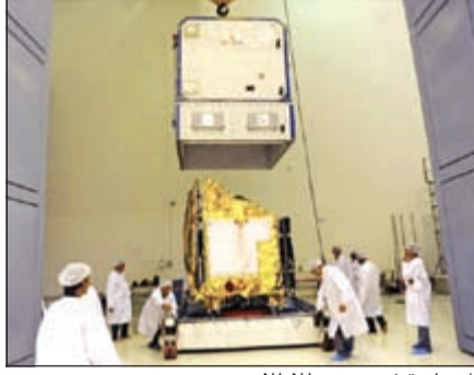
المسبار قبل تجهيزه للإطلاق

نيودلهي - يو.بي.أي: أطلقت الهند، أمس، لأول مرة، مركبة فضائية غير مأهولة إلى المريخ، في رحلة تستمر 300 يوم بهدف دراسة الغلاف الجوي للكوكب. وأفادت وسائل إعلام هندية بأن صاروخاً يحمل على متنه مركبة مانغاليان، أطلق في الساعة 2:38 بعد الظهر بالتوقيت المحلي للبلاد، من قاعدة سريهاريكوتا الفضائية على الساحل الجنوبي الهندي. وقد أكملت المراحل الثلاث لانفصال الصاروخ بنجاح. وقال المتحدث باسم منظمة أبحاث الفضاء الهندية، ديفيدراساد كارنيك، إنها بداية متواضعة لبعثتنا بين الكواكب. وهذه المرة الأولى التي تبعث بها الهند مركبة إلى المريخ، وقد أكمل المشروع خلال 15 شهراً بتكلفة 73 مليون دولار. وتحتاج المهمة 10 أشهر ليعلن عن نجاحها أو فشلها.