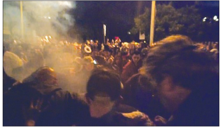
لحظة اخماد النيران من قبل بعض المحتفلين