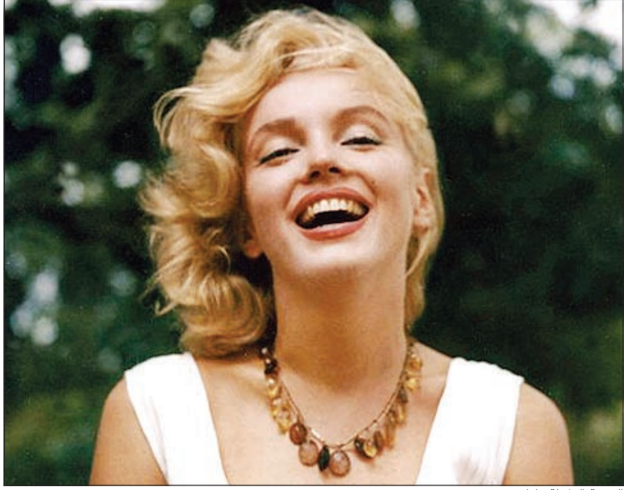
التجمة الراحلة مارلين مونرو

أم سرويال بيجاما؟ قميص نوم؟ فكان جوابي (شانيل رقم 5) لأن هذه هي الحقيقة! لن أقول لهم إنني أتأم عارية...» وعثر على التسجيل الصوتي في أكتوبر 2012 من قبل خدمة التراث في دار شانيل. وسببت إعلان تلفزيوني يتضمن هذا التسجيل في العالم بأسره اعتباراً من 17 نوفمبر الجاري. وتعود المرة الأولى التي قالت فيها مارلين مونرو أنها تضع «بضع قطرات عطر عندما تنام» في الواقع، التي مقابلة أجرتها العام 1952 مع مجلة «لايف» ولم تكن قد سجلت.