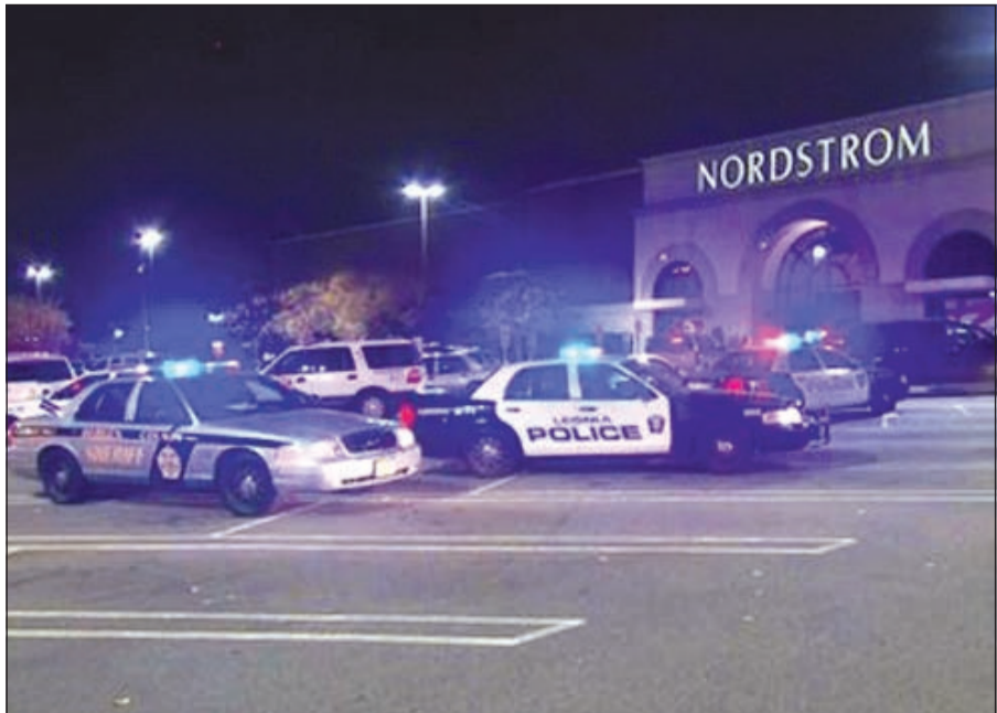
دوريات الشرطة الأميركية تحيط بالمجمع التجاري قبل اقتحامه