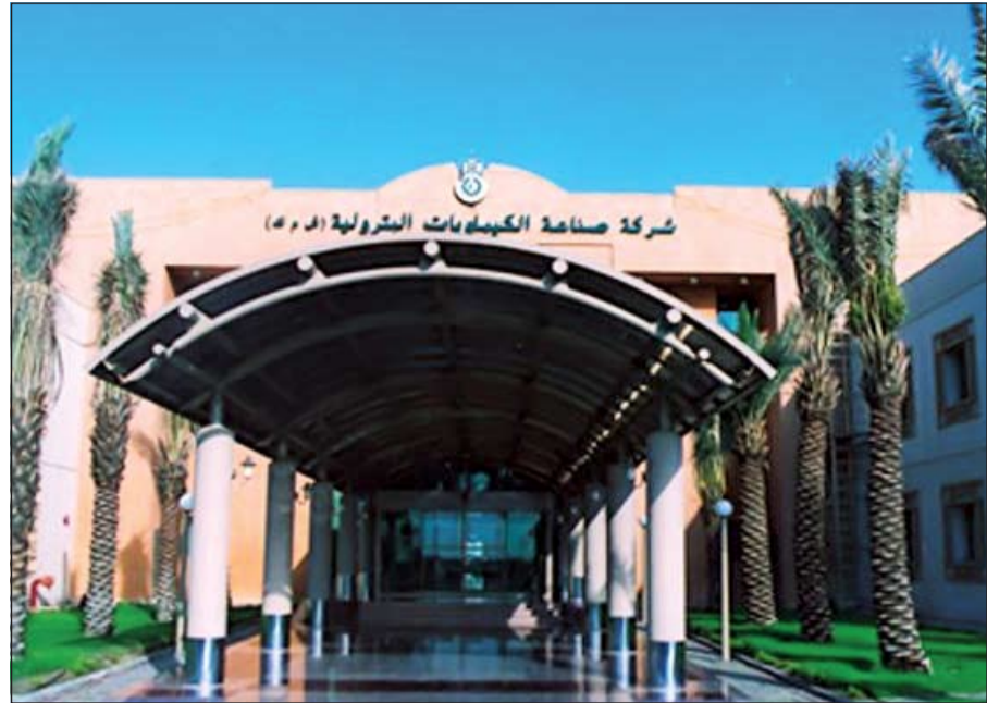
مقر شركة صناعة الكيمائيات البترولية

9/ وتقوم «ايكويت» بتشغيل وحدة البولي بروبيلين التابعة لشركة صناعة الكيمائيات البترولية. ومن استثمارات شركة صناعة الكيمائيات البترولية داخل الكويت الشركة «الكويتية للأوليفينات» والتي تنتج نحو 850 ألف طن سنويا من الإيثيلين ونحو 600 ألف طن سنويا من الإيثيلين جلايكول. و«الكويتية للأوليفينات» هي مشاركة بين شركة «صناعة الكيمائيات البترولية» بحصة قدرها 42,5٪ وشركة «داو كيميكال» بحصة قدرها 42,5٪ والقطن الخاص الكويتي ممثلا بشركة «القرين» بحصة قدرها 6٪ وشركة «بوبيان للبتروليمويات» بحصة قدرها 9٪.