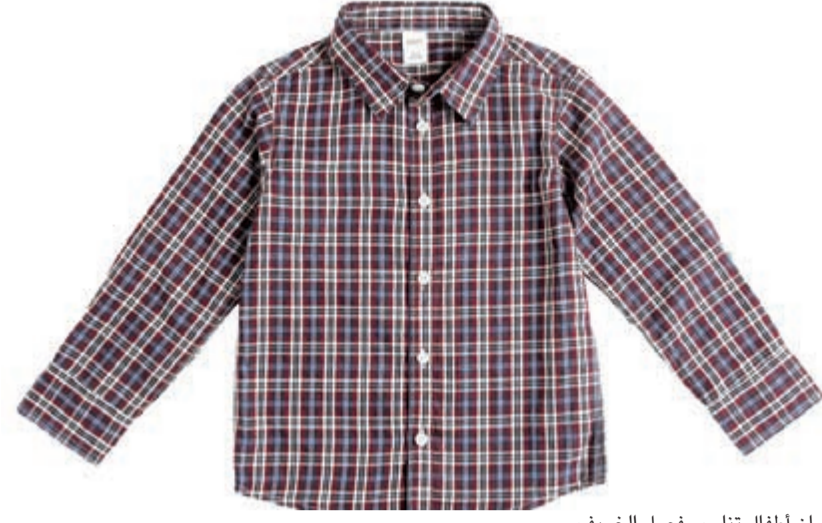
قمصان أطفال تناسب فصل الخريف

مع اقتراب انتهاء موسم الصيف يبدأ عشاق الأناقة المتميزين بالتفكير حول ملابسهم الخريفية والشتوية.