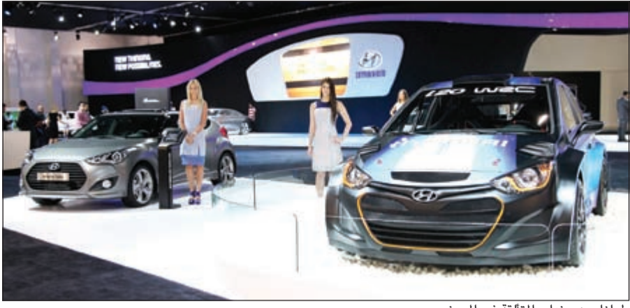
طرزات هيونداي المتألقة في المعرض