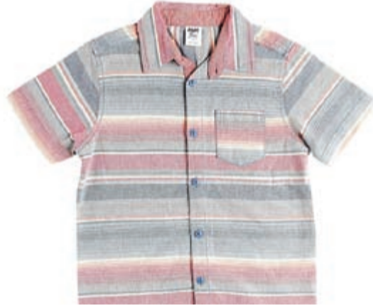
جيزرات مطبوعة للأطفال

وهي مستوحاة بشكل رئيسي من أجواء الهواء الطلق، وأبرز الأفكار التي تتمحور حولها تشكيلة هذا الموسم هي: وادي الثلج وعالم الرياضة و«قمصان» تي شيرت» المزركشة المحببة مع وفرة من القمصان ذات النقوش المربعة أو الحبيكات الكثيفة.