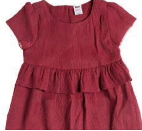
فساتين راقية للبنات تتناغم مع أصحاب الذوق الرفيع