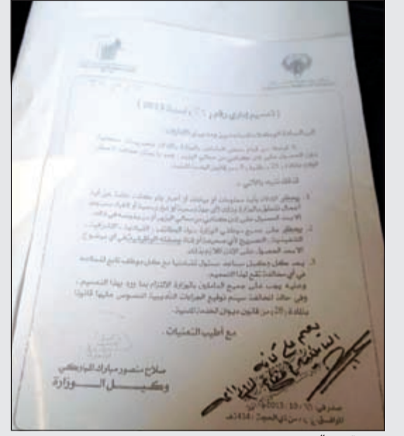
صورة عن التعميم

كبير، خصوصا العاملين في برامج التلفزيون والإذاعة الذين اعتادوا على تسليط الضوء عن برامجهم في الصحف اليومية للإعلان عن محتواها وضيوفها