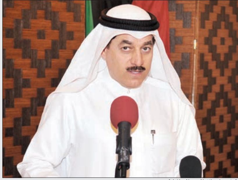
وكيل وزارة الاعلام صلاح المباركي