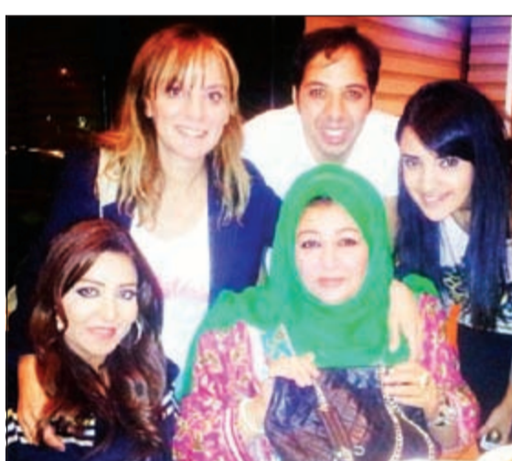
نسمة مع الفنانة القديرة عفاف شعيب التي تم تكريمها في المهرجان

الذي عرض رمضان الماضي، حيث جسدت فيه شخصية «فرحة الغازية»، مؤكدة ان هاتين الجائزتين ستدفعانها لتقديم الافضل من أعمال درامية أو مسرحية في الفترة المقبلة. وعن جديدها ذكرت الممثلة المصرية انها الآن في مرحلة القراءة لأعمال جديدة بالإضافة لاستعدادها لتصوير مسلسل كوميدي بعنوان «عجائب الدنيا» الأسبوع المقبل وهو من انتاجها بعد نجاح تجربتها الاولى في الإنتاج من خلال مسلسل «بنات شقية» الذي يعتبر أول عمل نسائي في الوطن العربي وأبطاله كلهن ممثلات بدون مشاركة أي فنان آخر ولا