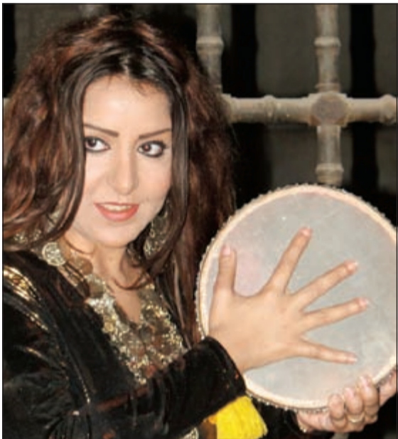
.. وفي مسلسل «النار والطين»

بعد تصريح المطربة شذى حسون للعديد من وسائل الاعلام أن الفنان الذي سيشاركها بطولة كليب اغنيته الجديدة «خطية» من كلمات الشاعر الغنائي عبدالله اللحى سيكون مفاجأة، خصوصا أنها اختارت شخصية خليجية شهيرة، علمت «الأنباء» أن من تصدى لبطولة الكليب هو الفنان الشاب عبدالله بوشهري، والذي اختير للجماهيرية العريضة التي صنعتها من خلال أعماله الدرامية والادوار التي جسدها وتركت انطباعا جميلا لدى الناس. وفي هذا الصدد توجهت «الأنباء» لبوشهري لمعرفة منه حقيقة الامر، حيث أكد صحة المعلومات، معبرا عن سعادته بالمشاركة في تصوير «خطية» أمام شذى حسون، وقال: عرض علي الكثير من الكليبات لأقوم بالمشاركة فيها، لكنني كنت اعتذر، حتى تم الاتصال بي للمشاركة في تصوير «خطية» وبعد سماعي للاغنية وجدت ان فيها دراما حقيقية ومساحة كبيرة للتعبير، كما ان شذى فنانة عربية معروفة وصاحبة خبرة في هذا المجال واعمالها منتشرة، ما اعطاني ثقة في النجاح، لذلك قبلت