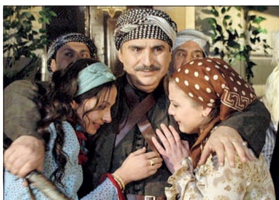
مشهد من «باب الحارة»