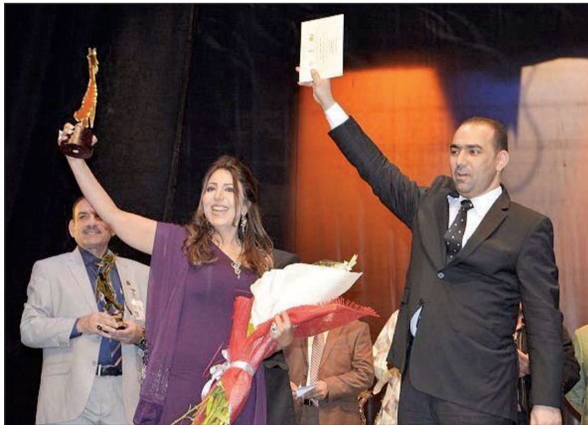
نسمة محمود بعد تسلمها جائزة أفضل ممثلة في مهرجان بغداد الدولي للمسرح