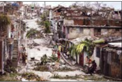
صورة أرشيفية لإعصار ساندي

نيويورك - أ.ف.ب: اعيد بناء عدة منازل بعد إعصار ساندي رغم المخاطر المحيطة بالمنطقة والتي دفعت سكان حي ساحلي في نيويورك إلى القبول ببيع منازلهم ليمحي حبيهم عن الخرابطة. فقد لقي ثلاثة أشخاص حتفهم إثر إعصار ساندي العام الماضي في حي أوكوود الواقع في جزيرة ستاين آيلند إحدى الدوائر الأكثر تضررا من الإعصار في نيويورك مع شبه جزيرة روكاواين.