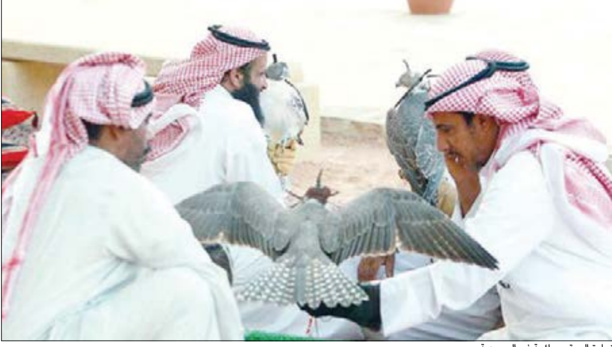
تجارة الصقور رائجة في السعودية

ولم يكن جو تيروني يتمتع بأي تأمين ضد الفيضانات، وكان منزله مغلقا منذ ذلك الحين وغير قابل للاستخدام. وقد بدأ البحث عن المساعدة واطلع على برنامج الحاكم أندرو كووو الذي يقضي بشراء المنازل الساحلية وهدمها ومنع تشييد مساكن في تلك المناطق. وأوضح جو تيروني أن السلطات «تعزز تحويل المنطقة إلى منطقة عازلة تحمي وسط الجزيرة». وقد عرضت السلطات أسعارا تتخطى بنسبة 10٪ قيمة المنازل قبل إعصار ساندي وقبل السكان بغرضها. وضمت اللائحة الأولى التي قدمت إلى الحاكم 135 اسما من أصل 185 ثم ارتفع هذا العدد إلى 184 بعد زيادة السعر بنسبة 10٪، علما أن البعض كان يخشى ألا تعرض السلطات إلا 50٪ من سعر المنزل. ومن الشروط التي اعتمدها السلطات لتقديم عرضها أن يكون المنزل ملك فرد من الحي وليس مجموعة عقارية.