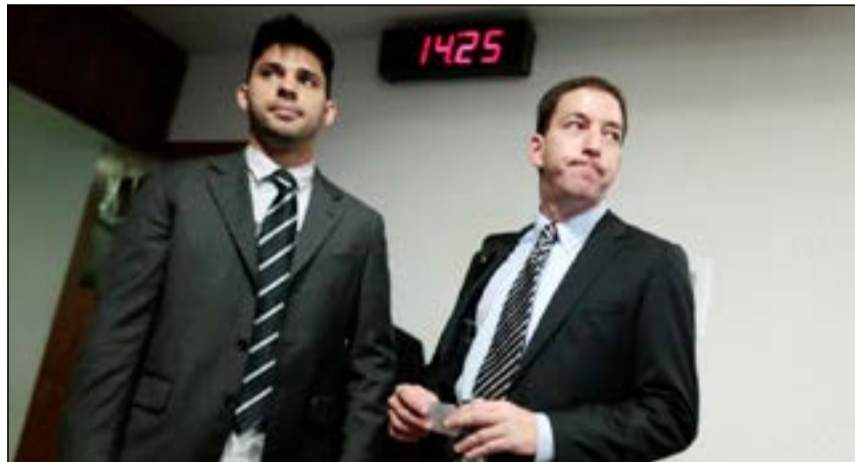
الصحافي الأميركي الذي نشر تسريبات ملفات سنودن لدى وصوله للشهادة أمام البرلمان البرازيلي أمس

بالتجسس». ومثل السفارة الأميركية الرجل الثاني في البعثة لي ماركليني إذ أن السفير غير موجود في العاصمة حاليا. كما قال الوزير الماليزي في بيان.