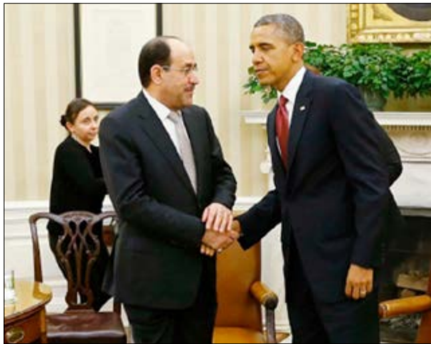
الرئيس الأميركي باراك أوباما مستقبلا رئيس الحكومة العراقية نوري المالكي في البيت الأبيض أمس الأول (رويترز)

تعدا بمحاربة «القاعدة» نريدا نظاما ديموقراطيا شاملا في العراق