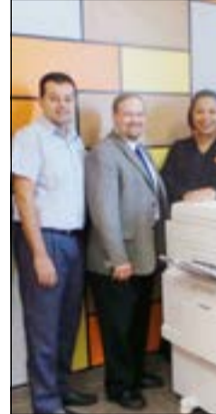
جناح أحد المشاركين في المعرض