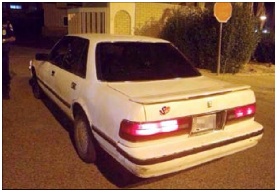
وسيارة أخرى تم ضبط صاحبها يستعرض

حالت سرعة استجابة وتدخل رجال الإطفاء دون وقوع إصابات في حريق في شقة تقع بالدور الثامن بأحد المجمعات السكنية بمنطقة حولي، وقال مصدر إطفائي إن البلاغ ورد صباح أمس وعليه توجه رجال الإطفاء إلى الموقع وقاموا بالسيطرة على الحريق وإخماده وإخلاء السكان بوقت قياسي وحالوا دون امتداد النيران إلى بقية الشقق المجاورة أو الأدوار الأخرى في البناية، وكان الحريق رغم أنه من النوع المتوسط قد سبب لقاطني البنائيات المجاورة خاصة أن أعمدة الدخان شوهدت في جميع أنحاء المنطقة قبل إخماده.