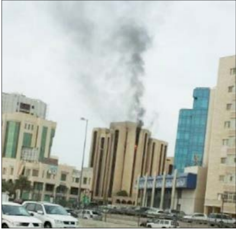
سحب دخان الحريق شوهدت من مسافة بعيدة