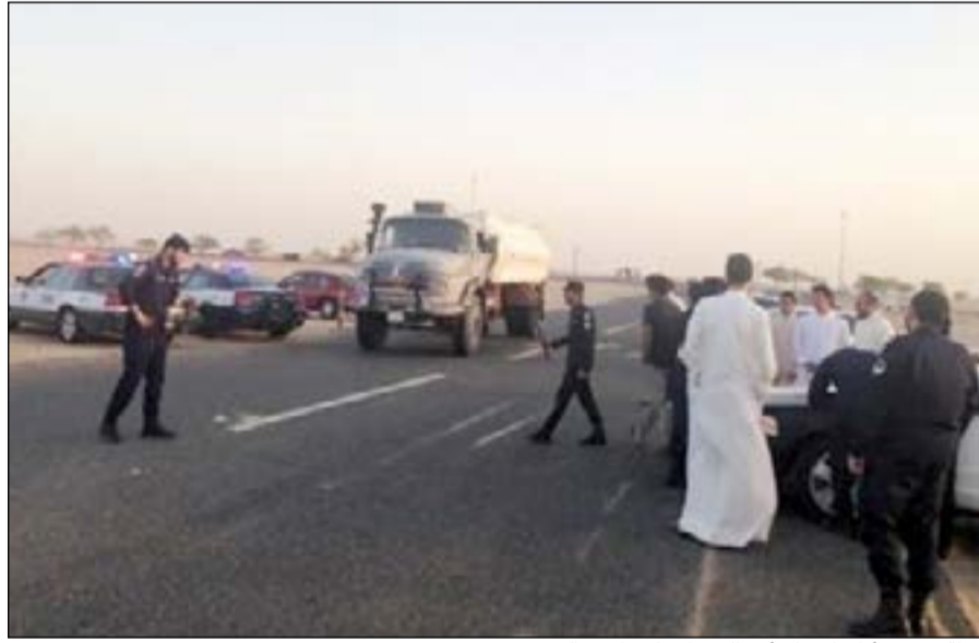
نقطة تفتيش أقامها رجال أمن الجهراء على طريق النوصيب

رجال دوريات أمن الجهراء وعمل طوق أمني في منطقة العيون وعلى سعيد متصل فقد قام رجال أمن الجهراء بعمل نقطة تفتيش على طريق العبدلي وتم تحرير 115 مخالفة مروية وحجز 13 واقدا مخالفا لقانون الإقامة وحجز ثلاث مركبات.