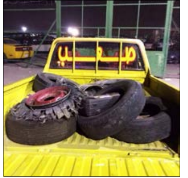
وانيت محمل بالاطارات تم ضبطه خلال الحملة

أمنية خاصة بمديرية أمن الجهراء انطلقت بقوة على رأسها اللواء الطراح والعقيدان فلاح محسن وفالح عوض والمقدم مطر السبيل والرائد غنيم العنتل على الصناعية ومنطقة العيون واستمرت نحو 5 ساعات وأسفرت عن تحرير 109 مخالفات وضبط 8 مركبات بقيادة أحداث و7مركبات تمت إحالتها إلى الحجز بعد تحرير