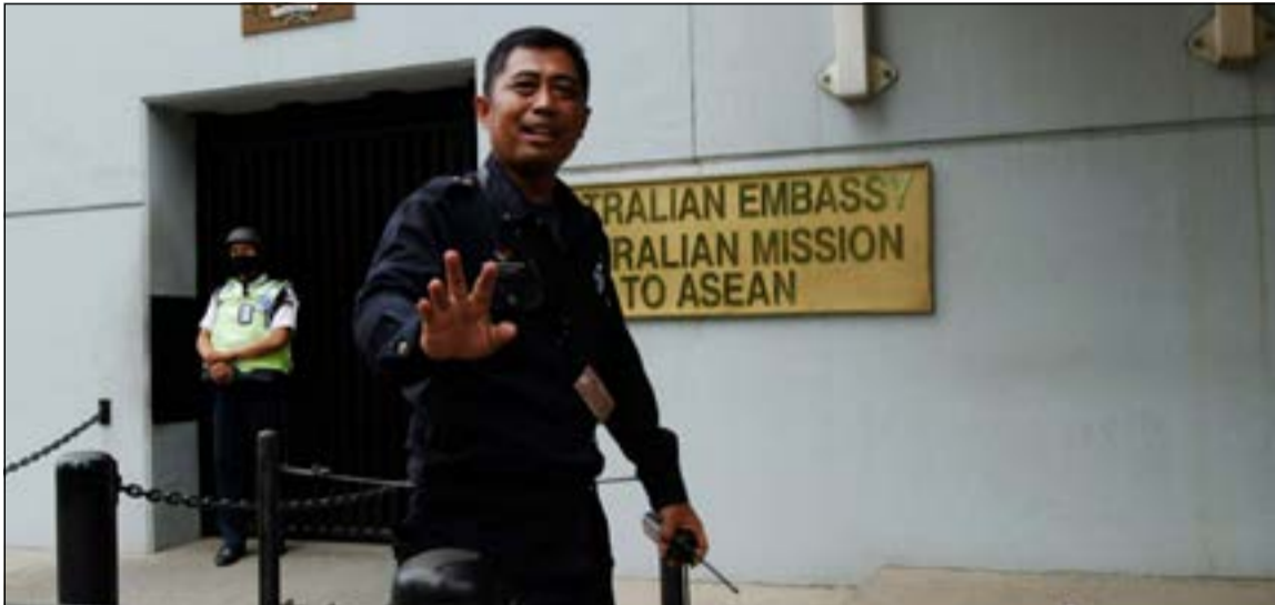
رجل امن يحاول منع الاعلام من التصوير امام السفارة الاسترالية في جاكرتا

لندن شارك فيه من واشنطن في بعض الحالات، أقر لكم، كما فعل الرئيس (الأميركي باراك أوباما)، بأن بعضاً من هذه التصرفات ذهب بعيداً جداً وسوف نحرص على ألا يتكرر هذا الأمر في المستقبل»، مبرراً هذه الممارسات بضرورة مكافحة الإرهاب.