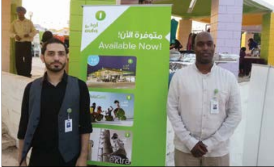
ركن «الأولى للوقود» خلال الاحتفال

وقد شارك بالحفل عدد كبير من العائلات الذين استمتعوا بقضاء يوم عائلي مميز بأجواء رائعة والكثير من الفقرات التي لاقت استحسان الحضور الذين أمضوا أوقاتا جميلة بالتواصل وتوطيد العلاقات الاجتماعية فيما بينهم.