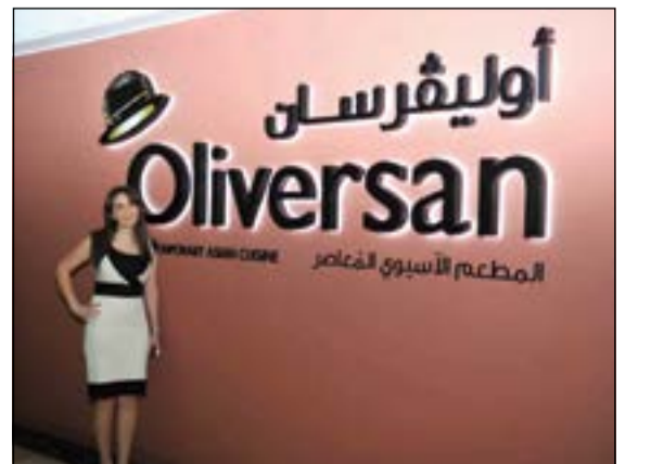
أوليفرسان اسم رائد في عالم المطاعم