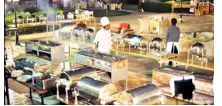
أشهى المأكولات تحت أضواء النجوم