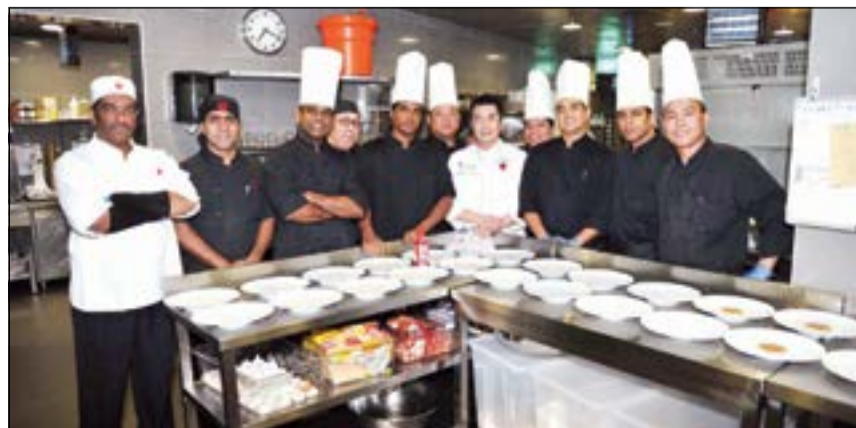
طاقم طهاة أوليفرسان واستعداد تام لاستقبال الزائرين