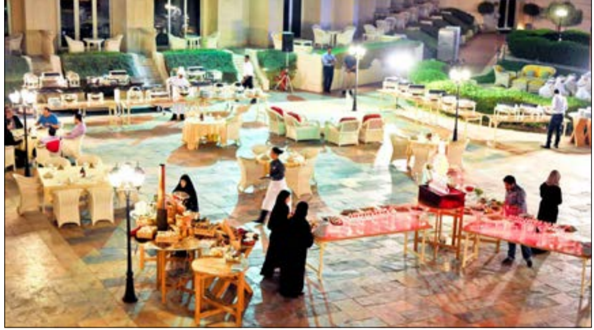
أمسية استثنائية وسحر لا يقاوم

في أمسية استثنائية حول أحواض السباحة وتحت أضواء النجوم والأناقة المترفة لفندق الريجيسي تم إطلاق أمسيات الباربيكيو المميزة وسط حضور كبير من عشاق نكهات الشواء الرائعة من رواد الفندق، وقد استمتع الحضور بمحطات الطهي المباشر والتي تنوعت لتقديم أجود أنواع اللحوم المختلفة وأطيب المذاقات للمأكولات البحرية المشوية وبالطبع بوفيه السلطات الغني بكل ما هو شهى ولذيذ وأيضا بوفيه الحلويات الذي لا يقاوم. وقد أعرب الحضور عن استمتاعهم بأمسية الباربيكيو الرائعة والمأكولات الشهية وسط أجواء الضيافة العربية الأصيلة والمقاييس العالمية التي يتبعها فندق الريجيسي في أدق التفاصيل.