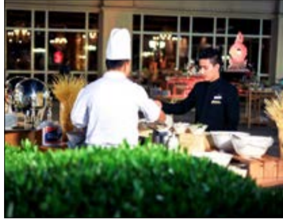
ليالي الباربيكيو تجربة فريدة

ليالي الباربيكيو يقدمها فندق الريجيسي كل أربعة من كل أسبوع حول منطقة أحواض السباحة من الساعة السابعة مساء.