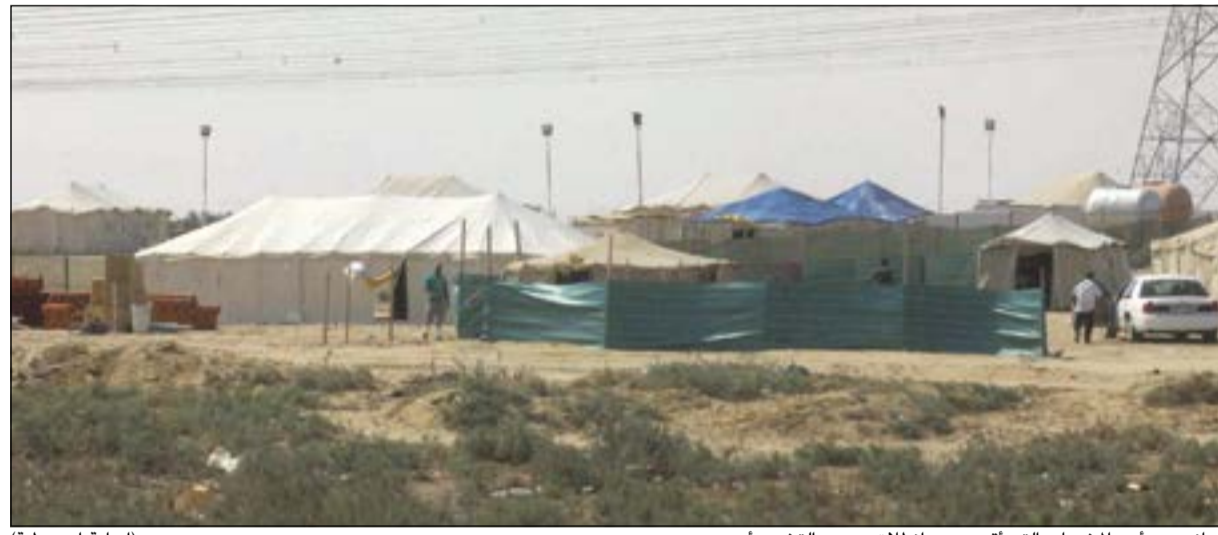
جانب من أحد المخيمات التي أقيمت مع انطلاق موسم التخيم أمس (إسماعيل أبو عطية)

الرياض - العربية: تسلم الأمير سلمان بن عبدالعزيز آل سعود، ولي العهد نائب رئيس مجلس الوزراء وزير الدفاع، شهادة الدكتوراه الفخرية في العلوم من جامعة سراييفو للعلوم والتقنية، وذلك نظير إسهاماته في مجالات العلوم ودعمه المستمر للتعليم والمعرفة في المملكة وجميع أرجاء العالم. جاء ذلك خلال استقبال ولي العهد في مكتبه بقصر اليمامة الخميس، مدير جامعة سراييفو د. محرم أفديسباهتش، ومدير جامعة سراييفو للعلوم والتقنية أيوب قانتش، ومدير جامعة تونزا أنور خليلوفتش. وقد حضر الاستقبال الأمير محمد بن سلمان بن عبدالعزيز رئيس ديوان ولي العهد، ووزير التعليم العالي د. خالد بن محمد العنقري، ومدير مركز الملك فهد الثقافي الملحق الثقافي السعودي في سراييفو د. خالد بن عبدالعزيز الدامغ، وسفير البوسنة والهرسك لدى المملكة حارس هلمر.