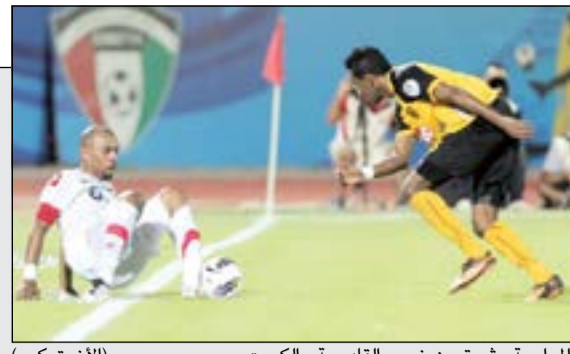
المواجهة مثيرة بين نجوم القاسية والكويت (الأزرق: كويم)