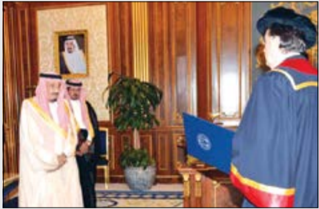
صاحب السمو الملكي الأمير سلمان بن عبدالعزيز أثناء تسلمه الدكتوراه الفخرية

ولي العهد السعودي يحصل على دكتوراه فخرية من جامعة سراييفو