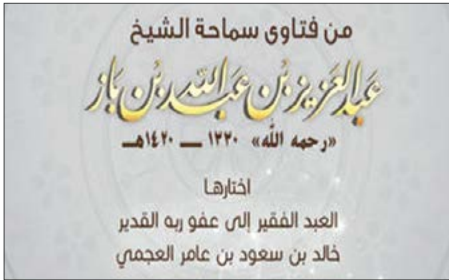
الاختيارات الفقهية من فتاوى الشيخ ابن باز

باتي هذا البرنامج ليلي حاجة الكثيرين من المستفتين وطلبة العلم الذين تهتمهم الاختيارات الفقهية للعلامة الراحل عبدالعزيز بن باز رحمه الله، حيث تكفلت هذه القبول لفتاواه والاستشهاد بها والاستناد إليها في الاختيارات الفقهية.