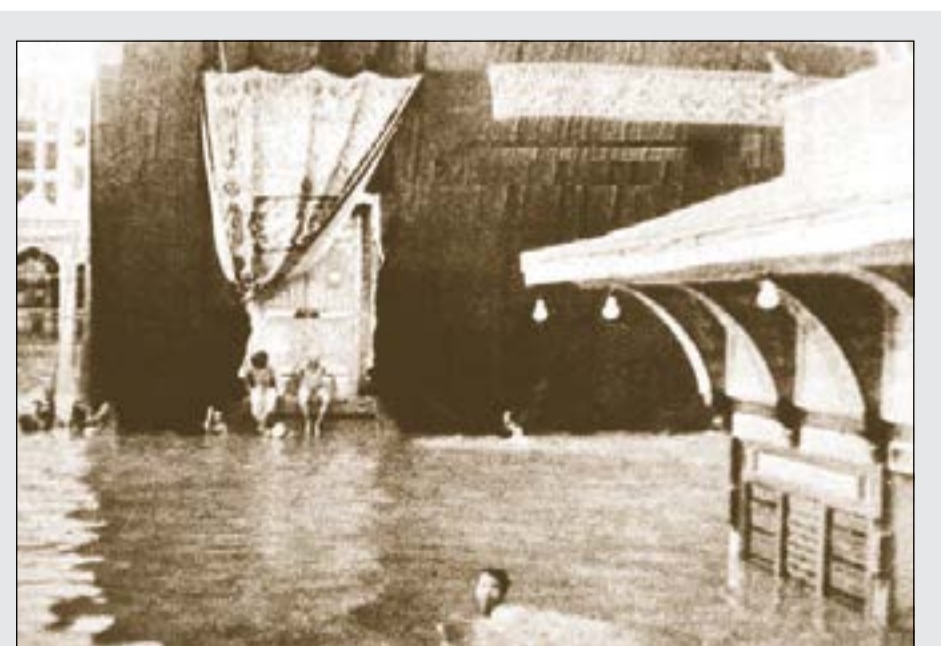
الطواف سباحة من بعض المعتمرين