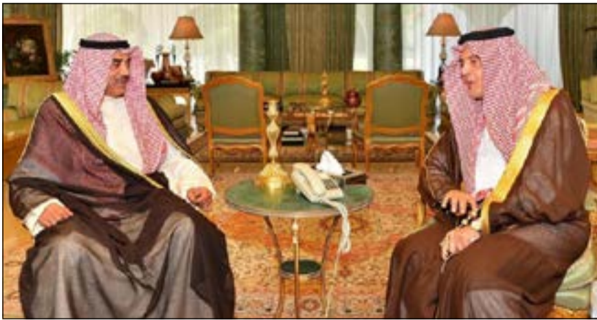
الأمير سعود الفيصل خلال استقباله الشيخ صباح الخالد

عبدالله بن عبدالعزيز ومدير إدارة مكتب نائب رئيس مجلس الوزراء ووزير الخارجية السفير الشيخ د.احمد ناصر المحمد وسفيرنا لدى المملكة العربية السعودية الشيخ فامر الجابر. وكان في استقبال نائب رئيس مجلس الوزراء ووزير الخارجية الأمير عبدالعزيز بن عبدالله بن عبدالعزيز وسفيرنا لدى المملكة الشيخ ناصر الجابر وعدد من المسؤولين. ويضم الوفد المرافق للشيخ صباح الخالد مدير إدارة مكتب نائب رئيس مجلس الوزراء ووزير الخارجية السفير الشيخ د.احمد ناصر المحمد وسفيرنا لدى المملكة العربية السعودية الشيخ فامر الجابر.