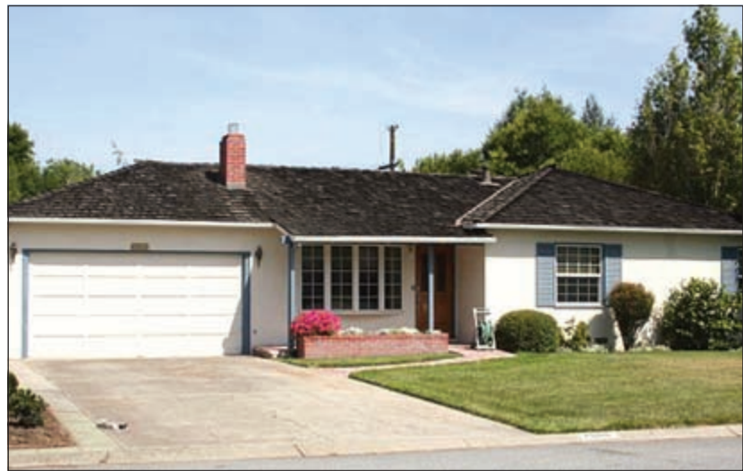
منزل ستيف جوبز التاريخي