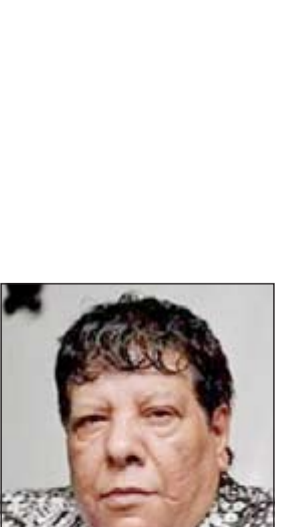
شعبان عبد الرحيم

القاهرة - وكالات: أطلق الفنان الشعبي المصري شعبان عبدالرحيم أغنية بعنوان النونو الضعيف وعرضها لأول مرة على برنامج العاشرة مساء المذاع على فضائية دريم أول من أمس والتي ينتقد فيها حكومة د.حازم الببلاوي، وكذلك د.محمد البرادعي، نائب الرئيس السابق، والإعلامي الساخر باسم يوسف، والرئيس الأميركي براك أوباما، ورئيس الأزهران التركي رجب طيب أردوغان ويشيد بالفريق أول عبدالفتاح السيسي، وزير الدفاع والإنتاج الحربي والنائب الأول لرئيس الوزراء. قال الإعلامي