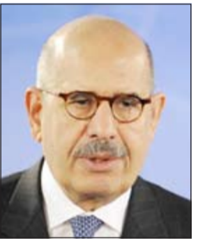
د. محمد البرادعي

ونجحت قوات الأمن في تطويق مبنى جامعة الأزهر بعد دخولها من بوابتي الطب والتربية، وقامت بإخراج رئيسها الذي كان