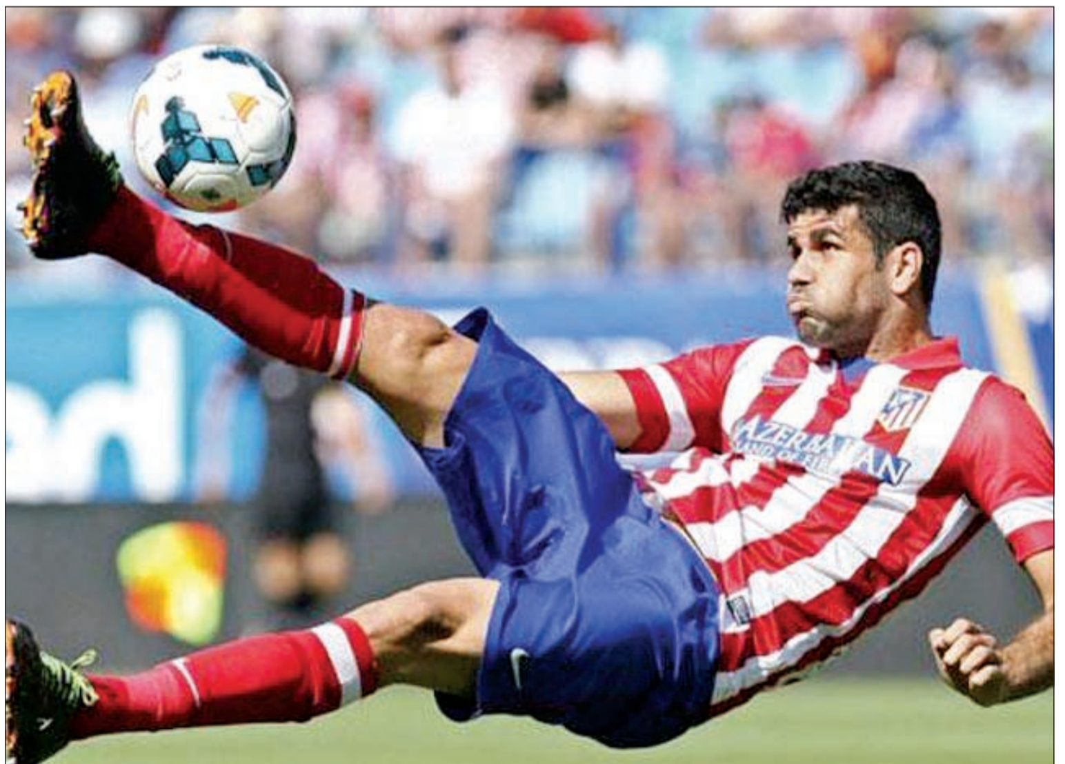
دييغو كوستا إضافة كبيرة للمنتخب الإسباني

لكنه عدل عن رأيه لأن ملف تحويل أهليته الدولية من البرازيل إلى إسبانيا لا يزال مغلقا. ونال كوستا الجنسية الإسبانية بعد أن أدىيمين الولاء في الخامس من يوليو الماضي. واستهل كوستا موسمه بشكل رائع، إذ سجل 10 أهداف في 9 مباريات لاتليكو مدريد في الدوري الإسباني بينها هدف الفوز على الغريم ريال مدريد، إضافة إلى هدفين في دوري أبطال أوروبا.